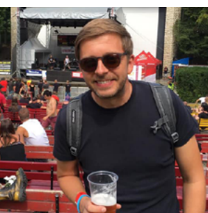
Na festivalu Valník ve Slaném