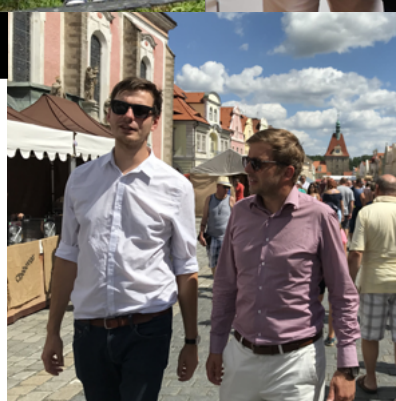
Při setkání v Petrovích