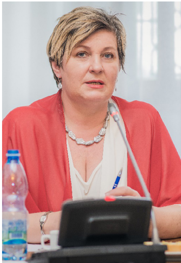
Věra Kovářová, poslankyně STAN

„Všechny tyto důvody nás vedly k tomu, že jsme se v uplynulých týdnech a měsících spolu se Sdružením místních samospráv České republiky snažili apelovat na ministerstvo dopravy, aby tyto nezamýšlené důsledky začalo konečně brát vážně a nezavíralo před nimi oči. Naše snaha vyvrcholila v polovině srpna, kdy jsme společně se SMS ČR, Asociací krajů ČR a SMO ČR odevzdali ministerstvu seznam kritických míst ve městech a obcích na silnicích 2. a 3. tříd, kde hrozí výrazné zvýšení kamionové nákladní dopravy. Cílem je, aby ministerstvo dopravy společně s policií tyto úseky zabezpečilo tak, aby zde kamiony nemohly sjíždět, vyhý-