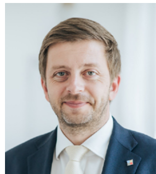
Vít Rakušan, předseda hnutí STAN

Myslím, že je dobře, že si můžeme naše spojení prověřit v dvojích volbách před těmi parlamentními. Pokud dokážeme postavit smysluplné koalice se silnými hejtmany – a já opravdu věřím, že nebudeme mít jen jednoho – pak máme obrovskou šanci ukázat lidem dobrou krajskou politiku. Pak jim snáz dokážeme vysvětlit, že si tróufáme na to spravovat stát i z vládních lavic. Cesta k tomu je však ještě hodně dlouhá a záleží na mnoha okolnostech, třeba také na tom, zda budou předčasné volby nebo ne. Chtěl bych nicméně naše členy a příznivce přesvědčit o tom, že jsou naše úmysly dobré a že povedou k dobrým cílům, aniž by STAN jako takový nebyl vidět. Naopak – jsme hybateli vzájemné spolupráce, ve kterou upřímně věřím. V některých senátních obvodech podpoří STAN kandidáta jiných uskupení, ale vedeme o tom pečlivou debatu. A jestli můžu ještě za něco poděkovat: z letních cest si odvážím strašně dobrý pocit z práce našich komunálních politiků. Jsem na ně pyšný, z mnohých z nich už brzy možná budou krajští radní a možná i hejtmani či hejtmanky. Těším se na to. Čeká nás rok plný práce.