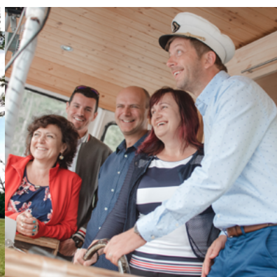
Cesta lodí po Dalešické přehradě