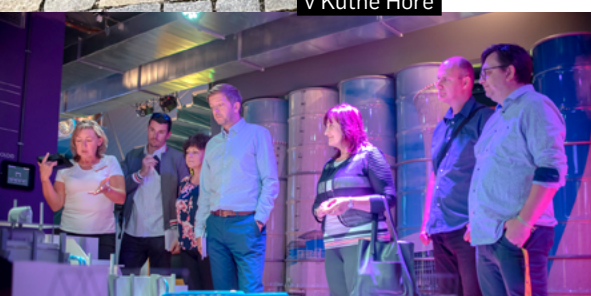
Na prohlídce JE Dukovany