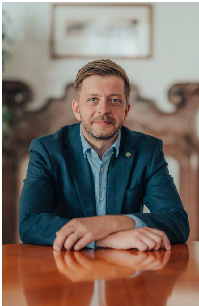
VÍT RAKUŠAN, předseda hnutí

Bitevní pole jsme si z části vytvořili sami. Vršili jsme chybu za chybou, nový tlak, nové hřiště. Ze sálového fotbalu jsme vyběhli na dlouhatánský zelený trávník, kde jsme se i přes občasné hezké kličky ztráceli, špatně orientovali.