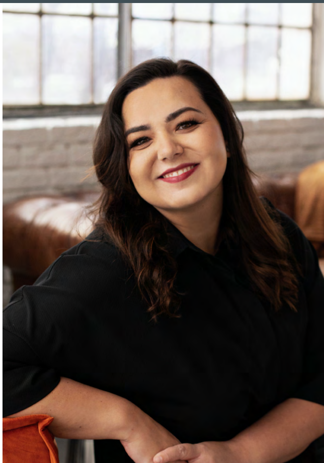
BARBORA URBANOVÁ, poslankyně

I proto jsme v Poslanecké sněmovně již podruhé schválili možnost odpuštění dluhů vůči státu. I při druhém milostivém létě, nutno dodat: odehrávajícím se však na podzim, musí dlužníci projevít aspoň základní zájem o odpuštění dluhů, a je to tak správně. V čem ale jako stát, možná lépe řečeno jako společnost, selháváme, je v propagaci tak užitečného "nástroje", v aktivním vyhledávání těch, kterých by se tato akce mohla týkat, v jejich motivaci. A co si budeme povídat, situace byla dovedena do takového stavu, ve kterém jsme nechali mnoho lidí tak dlouho, že už ani pomoc neočekávají, nechtějí, nevěří. Jestli je něco průšvihů tak je to to, že si tu aktivně vytváříme společnost, která nebude mít zájem podílet se na budoucnosti. Nedožrnný problém. Do toho tu máme nezákonné exekuce. Podle odhadů jich je statisíce, přičemž jsou vedeny s vědomím exekutora i soudu, ale bránit se musel (a vlastně dodnes musí) dlužník sám. I v tomto ohledu toho hodně podnikáme, sešli jsme se se zástupci Ministerstva spravedlnosti a vytváříme prostor pro debatu s odbornou veřejností, která hlásí jak to vypadá v terénu, v regionech.