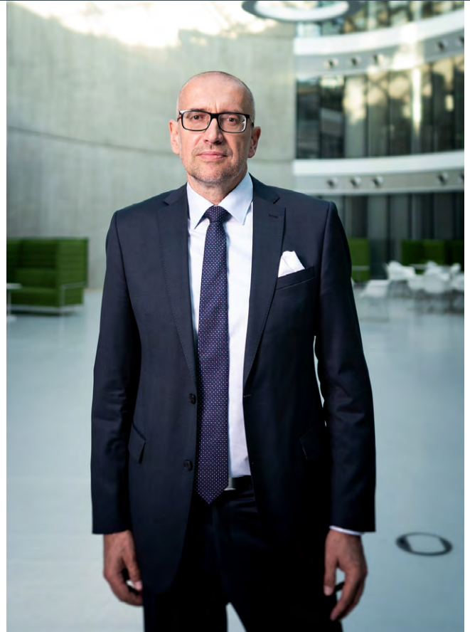
MIKULÁŠ BEK, ministr pro evropské záležitosti

Velkého úspěchu dosáhlo české předsednictví také v digitální oblasti. Během vyjednávání s Evropským parlamentem se podařilo dohodnout na podobě programu digitální dekády.