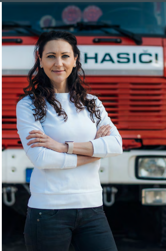
MICHAELA OPLTOVÁ, poslankyně

Do sněmovny jsem přišla s vizí sjednocení záchranného systému v České republice. Velkým problémem naší kritické infrastruktury je, že nemá ucelenou legislativu a spadá pod různé úřady státní správy. Problematické je především v letní sezóně a při povodních zapojování vodních záchranářů, kteří jsou vedeni jako spolek pod Ministerstvem vnitra. Naopak třeba Horská služba spadá pod Ministerstvo pro místní rozvoj. Osobně bych ráda prosadila, aby byly složky kritické infrastruktury