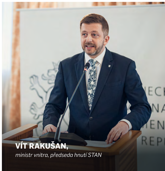
VÍT RAKUŠAN, ministr vnitra, předseda hnutí STAN