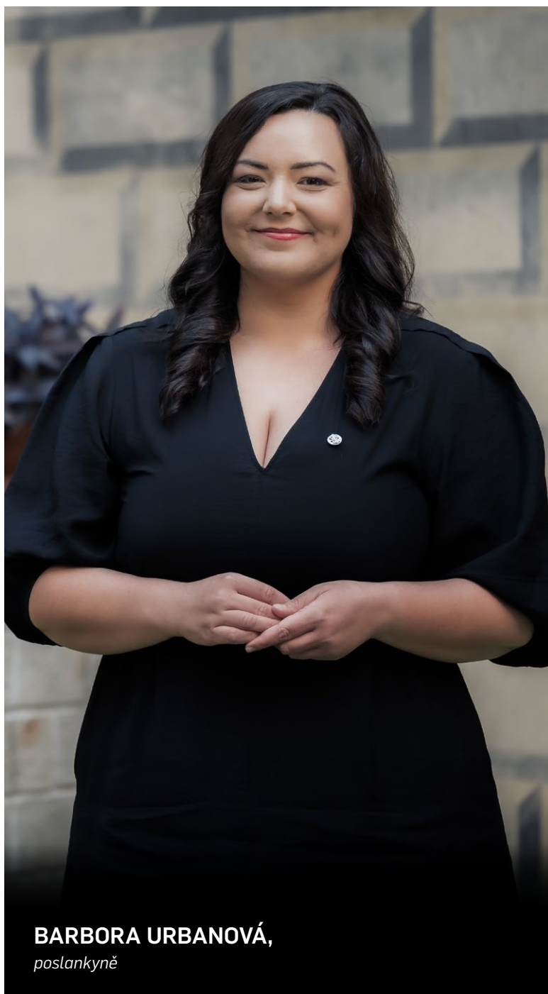
BARBORA URBANOVÁ, poslankyně

„A co děláte pro mladé?“ ptají se často novináři. A co hůř. „Vy pro nás nic neděláte,“ dočteme se v článcích přímo od mladých lidí. První reakce politiků a političek bývají tak trochu uražené a možná lítostivé pomyslení na to všechno, co kdy řešil pro mladé lidi. Jenže... Oni o tom neví. A jejich chyba to fakt není.