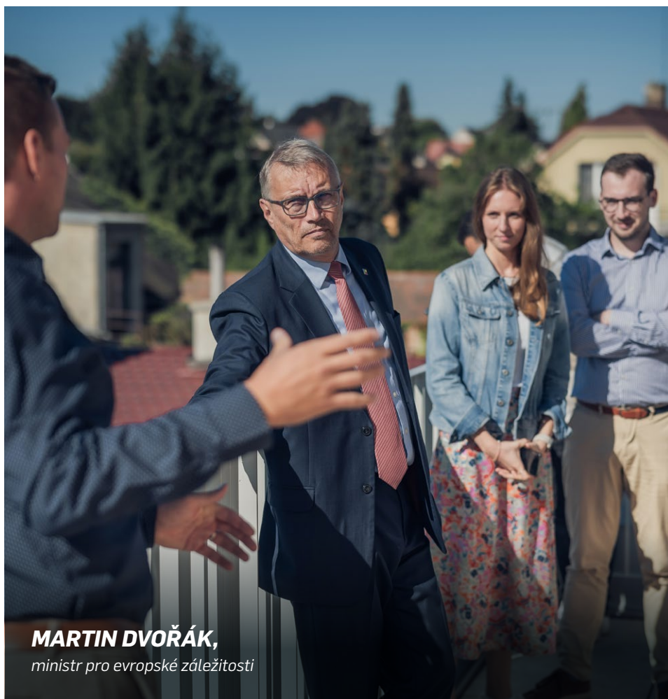
MARTIN DVOŘÁK, ministr pro evropské záležitosti

No a nemůžu vynechat ani otázku eura. Po letech se s ní podařilo rozvířít stojatý rybníček české politiky a dostala se do popředí veřejné diskuze. Jmenováním zmocněnce jsme otázku eura posunuli víc, než co se podařilo za uplynulých dvacet let. Máme teď jasné termíny a úkoly, pokud jde o směřování ke společné měně. I když se tento krok setkal se spoustou kritiky, pomohl udržet veřejnou diskuzi o euru a zajistil nám ekonomickou a legislativní analýzu přijetí eura. Ty se budou projednávat koncem roku na vládě. A to je velký krok vpřed!