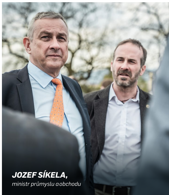
JOZEF SÍKELA, ministr průmyslu a obchodu

Kromě obnovitelných zdrojů bude stát výroba elektřiny na jádru. Proto intenzivně pracujeme na výstavbě nových jaderných zdrojů. Smlouvy s budoucím dodavatelem chceme mít připravené do konce března příštího roku. Energetika je složitá oblast, kde jednoduchá řešení neexistují. Proto je třeba hledat ta funkční, která zajistí pro občany a podniky dostatek energií za dostupné ceny. A na tom pracuji.