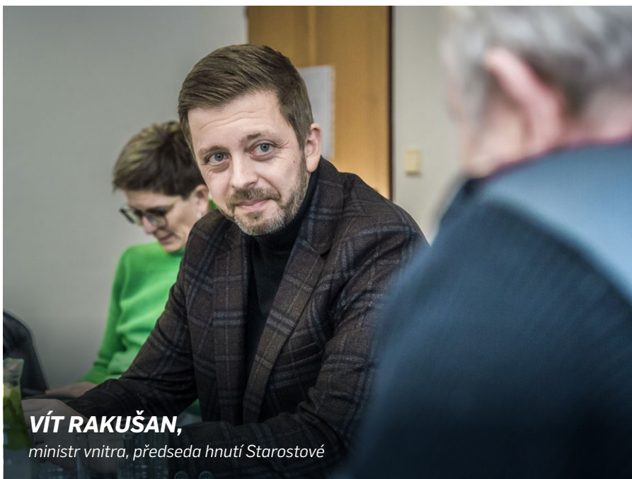
VÍT RAKUŠAN, ministr vnitra, předseda hnutí Starostové

Mým úkolem a cílem je posunout Ministerstvo vnitra a jeho agendu do 21. století. Z ministerstva represe vybudovat ministerstvo bezpečí, které pečuje o vnitřní bezpečnost České republiky a je stabilním prvkem v zajišťování bezpečnosti našich občanů. Z ministerstva, které svou budovou ze 40. let minulého století bude jen klamat tělem, a stane se moderním a přívětivým úřadem, který občany zbytečně nezatěžuje a v potřebných chvílích jim je ku pomoci. Ministerstvo plné bezpečnostní agendy transformovat do nositele digitalizace a efektivizace veřejné správy, modernizace legislativy a vstřícného přístupu k měkkým tématům. Z nepružného ministerstva vytvořit resort, který dokáže rychle reagovat na aktuální hrozby a je schopný jim dlouhodobě a udržitelně čelit. To je ministerstvo, které chci na konci svého funkčního období vidět.