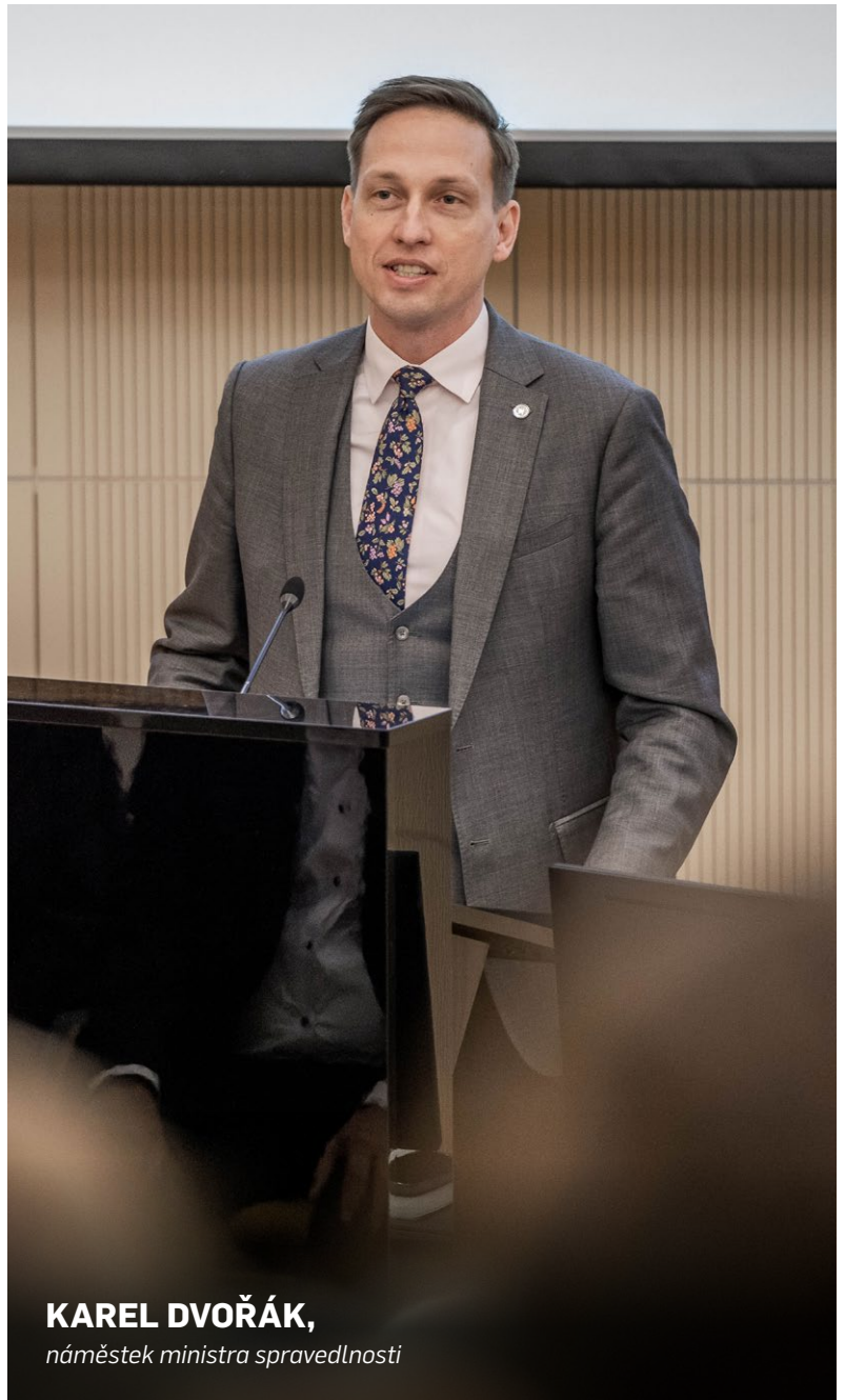
KAREL DVOŘÁK, náměstek ministra spravedlnosti

Zavedeme funkční systém evidence opatrovanců, což pomůže obcím s financováním výkonu veřejného opatrovnictví.