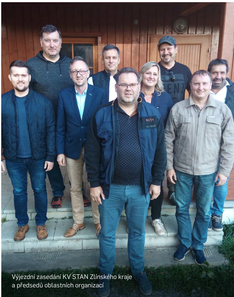
Výjezdní zasedání KV STAN Zlínského kraje a předsedů oblastních organizací