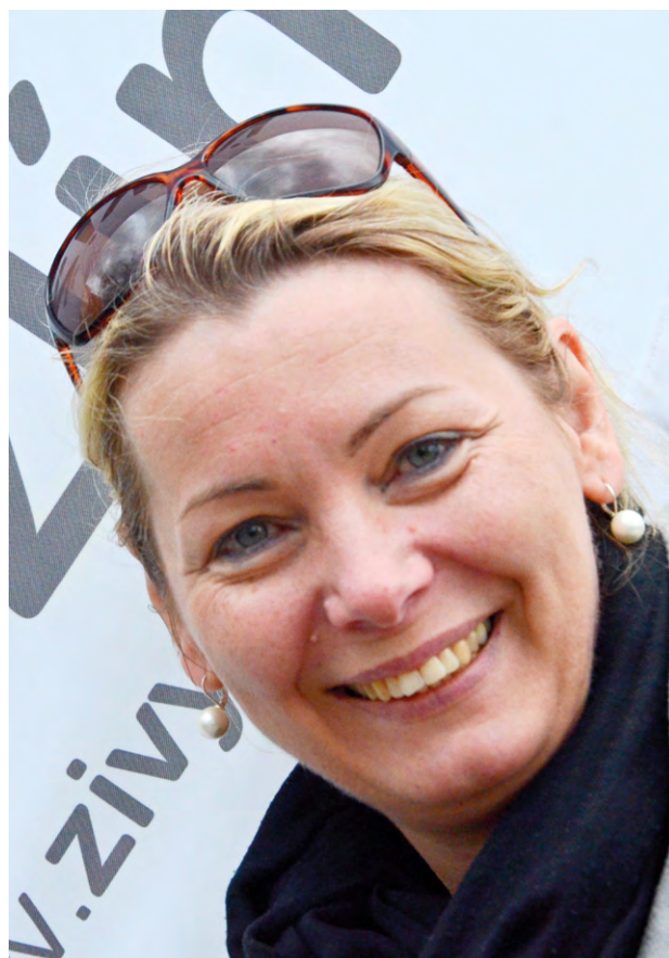
KATEŘINA FRANCOVÁ, náměstkyně primátora Zlín

Prostřednictvím vlastního městského bytového družstva chceme poskytnout lidem výhodné bydlení. Výhodou bytového družstva založeného městem, oproti jiným družstvům či jiným formám bydlení, může být výsledná cena bytu a možnost jednoduššího financování pro družstevníky.