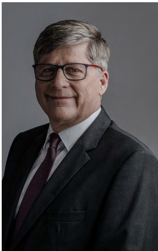
JIŘÍ HÁJEK, poslanec

Současně navrhovaná podpora je naproti tomu cílená, zejména na menší podnikatele, kteří nemají dostatečnou finanční rezervu. Nebude tak snad docházet ke zneužívání jako v minulosti. Podmínkou pro získání kompenzace je propad tržeb alespoň o 50 %, a to při srovnání posledních dvou měsíců let 2021 a 2019. Z logiky věci tak jde především o stánkaře a pořadatele adventních trhů. Právě tyto podnikatelé utrpěli nejvíce. Na období před Vánoci, kdy lidé rádi utrácejí, se chystali dlouhou dobu. Vysoké tržby jim často pokrývají předchozí slabší měsíce. Najednou byli na suchu. Dostane se samozřejmě i na další – restaurace, hotely nebo pořadatele sportovních akcí. Celkem by se o pomoc mohlo přihlásit více než 12 tisíc subjektů. A pro pořádek – jsem rád, že mezi nimi nemohou být ti, kteří provozují pouze hazardní hry.