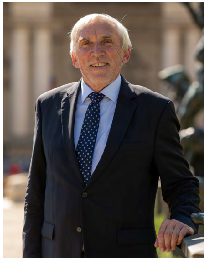
JIRÍ RŮŽICKA, 1. místopředseda Senátu PČR

Zmíněný zákon tato negativa řeší a umožňuje fungování škol bez nutnosti jejich celoplošného uzavírání. Je v zájmu nás všech, aby bylo žákům a pedagogům po co nejdéle, pokud to pandemická situace dovolí, umožněno společně pracovat se získanými vědomostmi, společně řešit problémy, komunikovat, společně pracovat na projektech, tvořit, smát se či se dělit o zážitky s ostatními. Jsem rád, že si nově zvolená vláda, konkrétně ministr školství Petr Gazdík, uvědomila závažnost tohoto tématu a přišla s návrhem zákona, který bere v potaz nenahraditelnost společných zážitků, důležitost kontaktu s ostatními a rozvoj sociálních vazeb, které mají závažný vliv na vývoj každého jednotlivce a tedy celé společnosti.