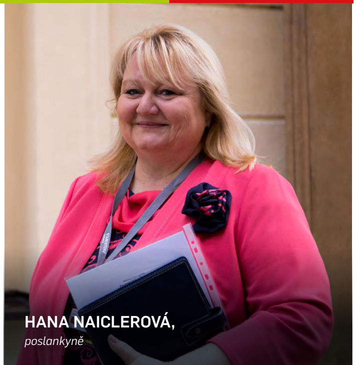
HANA NAICLEROVÁ, poslankyně

V současnosti pokračujeme v debatě s našimi koaličními partnery, abychom našli shodu v otázce spravedlivého zdanění alkoholu. V hnutí STAN tyto nelogické výjimky dlouhodobě odmítáme. Jsme přesvědčeni, že mají platit stejná pravidla pro všechny a má být rovnost mezi všemi výrobci alkoholu. Pokud spotřební daň zvládnou platit i zadministrovat malé pivovary, nevím, proč by to nedokázali vinaři.