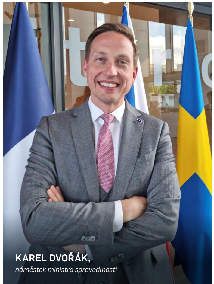
KAREL DVOŘÁK, náměstek ministra spravedlnosti

V dohledné době lze očekávat nárůst počtu osobních bankrotů zejména kvůli následkům koronavirové krize a krize spojené s válkou na Ukrajině. I proto je nezbytné schválit novelu co nejdříve, aby byl systém připraven pomoci co nejvíce lidem. Souběžně s přijetím novely bychom v regionech měli vést informační kampaň, aby se dlužníci o výhodách nového oddlužení dozvěděli, protože až 45 % z nich oddlužení nerozumí nebo o něm vůbec neví. Data ukazují, že příznivá změna podmínek pro vstup do oddlužení a dostatek informací by mohly rozšířit podíl dlužníků ochotných ke vstupu téměř čtyřnásobně; zatím do něj vstupuje