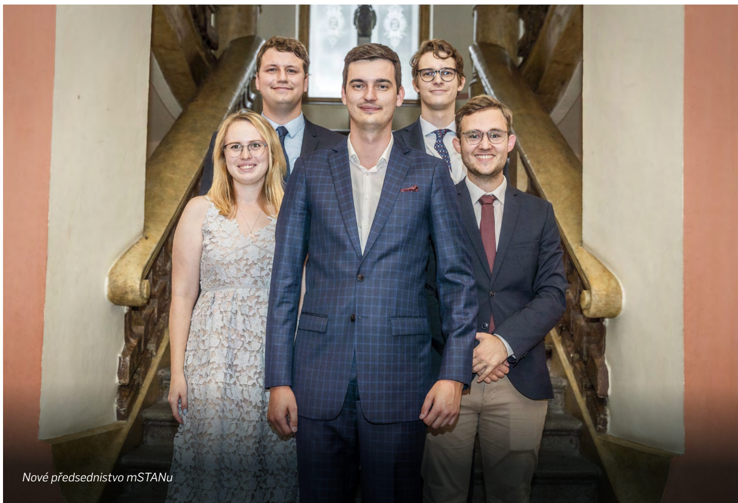
Nové předsednictvo mSTANu