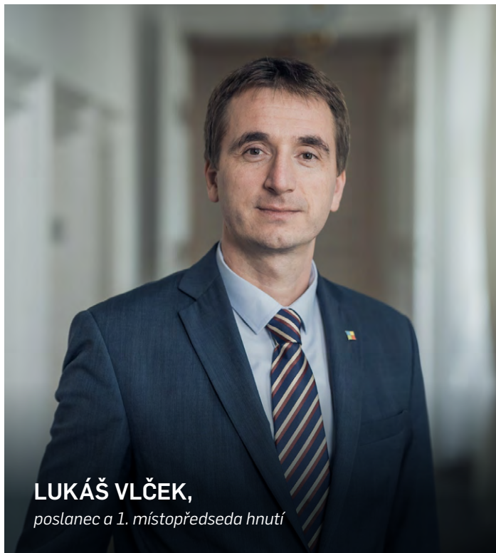
LUKÁŠ VLČEK, poslanec a 1. místopředseda hnutí