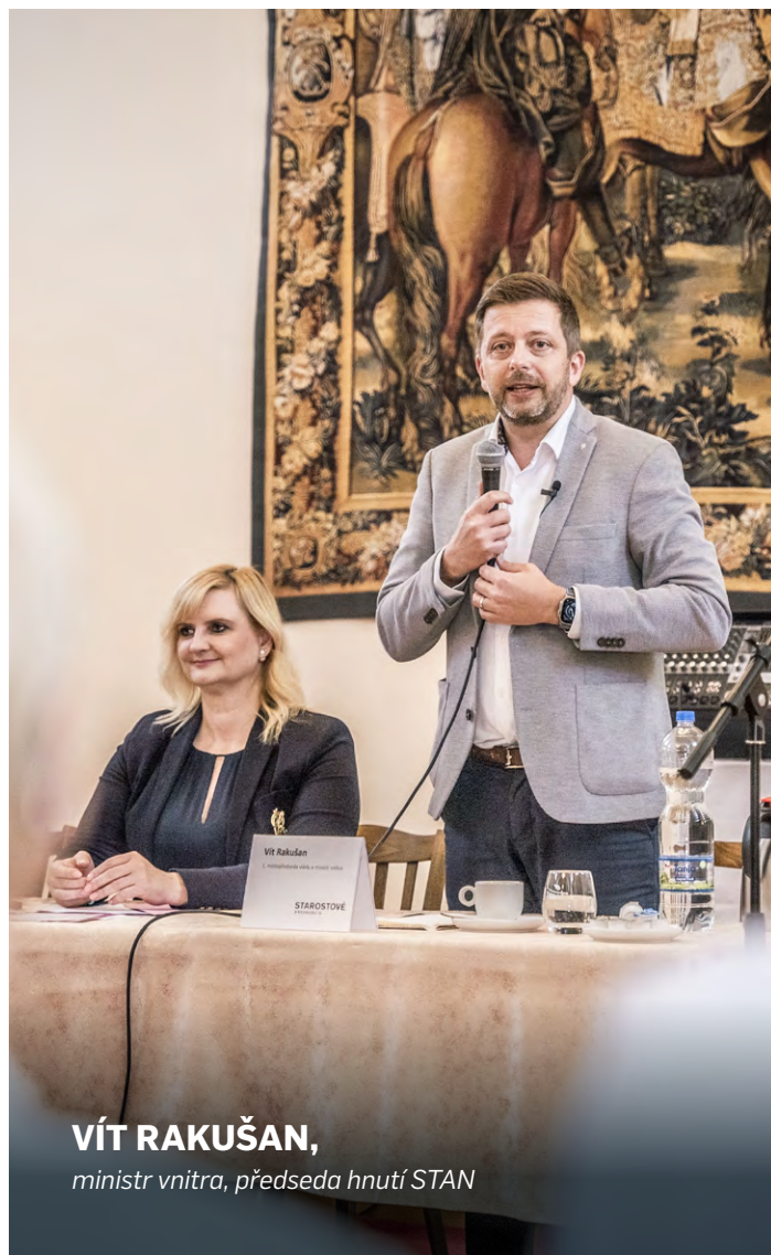
VÍT RAKUŠAN, ministr vnitra, předseda hnutí STAN

Není ovšem možné, aby se některá z členských zemí na řešení migrace nepodílela vůbec. A v tom je jádro kritiky migračního paktu, která zaznívá od ANO, SPD a (chce se mi napsat dalších) extremistů: pod zástěrkou kritiky (neexistujících) povinných kvót, zpochybňování „povinné solidarity“ a výkřiky o „zradě“ se skrývá jediné: Neochota jakkoliv se podílet. Ti, kdo tvrdí, že nechtějí pomáhat „povinně“, ve skutečnosti nechtějí pomáhat vůbec. Jestli je to „jen“ sobectví, nebo kalkul – vždyť Andrej Babiš už strašením