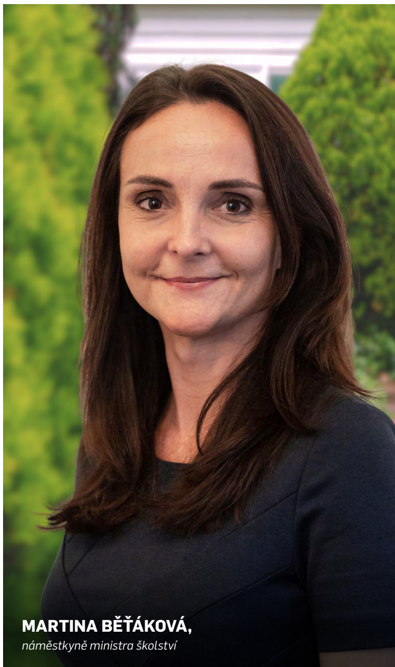
MARTINA BĚŤÁKOVÁ, náměstkyně ministra školství