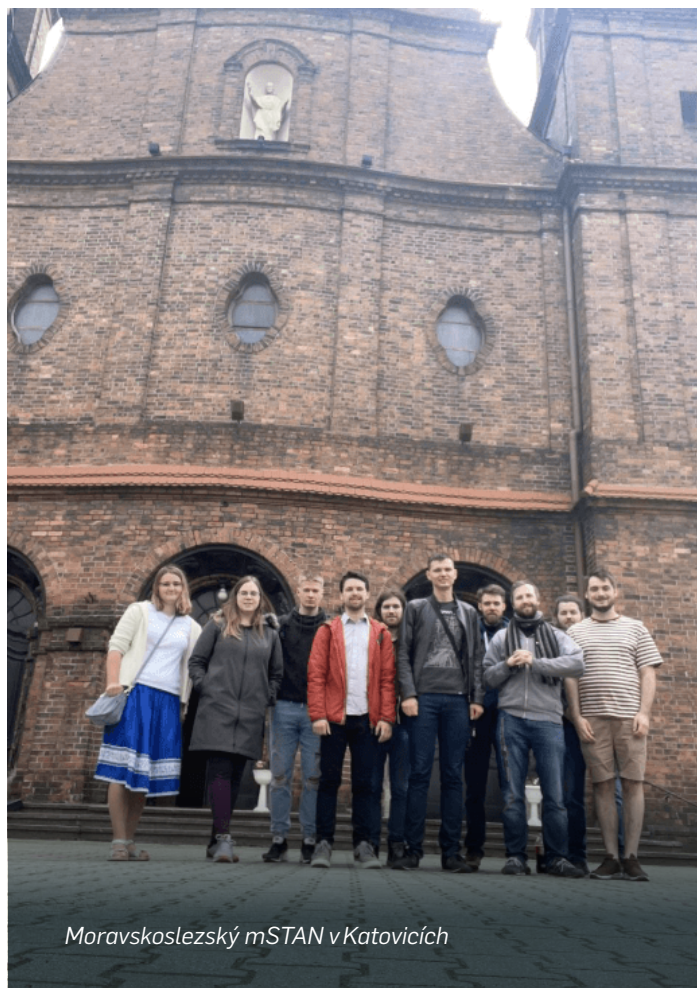
Moravskoslezský mSTAN v Katovicích

Zlehka nastával večer, kdy jsme se potřebovali pomalu přiblížit vlakovému nádraží. Naší pozornosti neuniklo velkolepé prostranství mezinárodního kongresového centra a z její zelené střechy jsme při zlaté hodině obdivovali ikonické stavby, jimiž jsou především hala Spodek, budova filharmonie či Slezské muzeum.