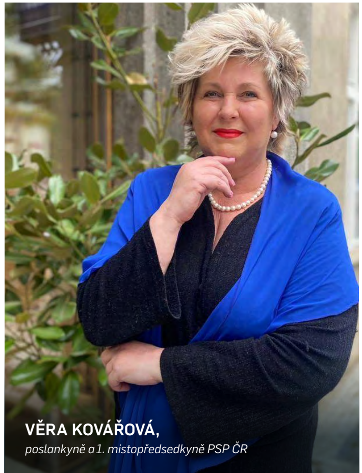
VĚRA KOVÁŘOVÁ, poslankyně a 1. místopředsedkyně PSP ČR

Už nějakou dobu vyjednávám s podporou profesních sdružení a především Hospodářské komory České republiky na Ministerstvu financí ČR o řešení tohoto „detailu“. Není to jednoduché. Ale můžeme se opřít o řešení, která byla alespoň pro potraviny přijata v řadě evropských zemí. A také přemýšlet nad mechanismem, který by přinejmenším výhledově umožnil tuto otázku řešit širěji. Ve hře je několik technických možností. Třeba možnost řešit problém DPH v případě darování registrovaným a ověřeným příjemcům, což je postup, který v některých státech dobře funguje. Všem je nám jasné, že příliš velké otevření dveří by mohlo být