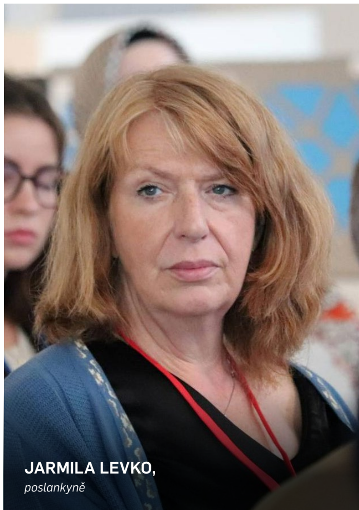
JARMILA LEVKO, poslankyně

O práci v PS NATO příliš nemluvíme, protože opoziční politici i část veřejnosti nám podsouvá, že angažování v zahraniční poli-