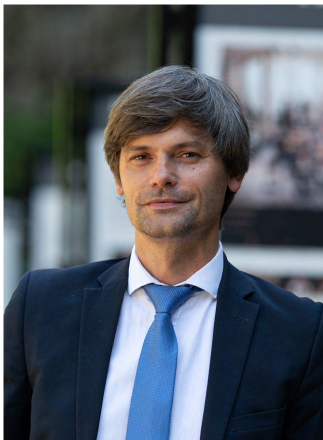
MAREK HILŠER, senátor

Na závěr je třeba poznamenat, že korespondenční způsob volby je standardním nástrojem v drtivé většině demokratických zemí. V Evropské unii mohou v různé podobě korespondenčně volit občané ve dvaceti čtyřech zemích. Například Sloven-