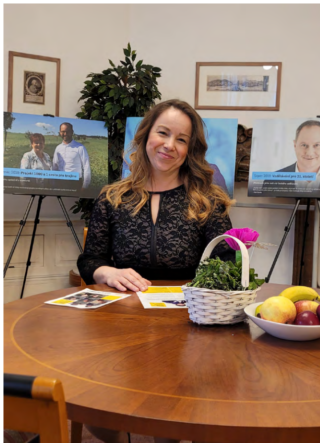
MICHAELA ŠBELOVÁ, poslankyně

U našeho dalšího konkursu jsme už proto postupovali jinak a hledali uchazeče, který je empatický, sleduje novinky ve vzdělávání a má chuť zavádět je do praxe. Člověka, který má ambici utvářet úspěšnou školu, do které by sám rád chodil. Proč jsme si to takto nastavili? Protože jsme nechtěli ředitele, jehož jedinou starostí je správa a údržba budovy, aktualizace směrnic a rozpočet. Ano, jsou to důležité věci, navíc se snadno kontrolují. Proto jsou bohužel pro mnohé zřizovatele hlavním kritériem (mimořádně, i u našeho konkursu mne fascinovaly dvě otázky