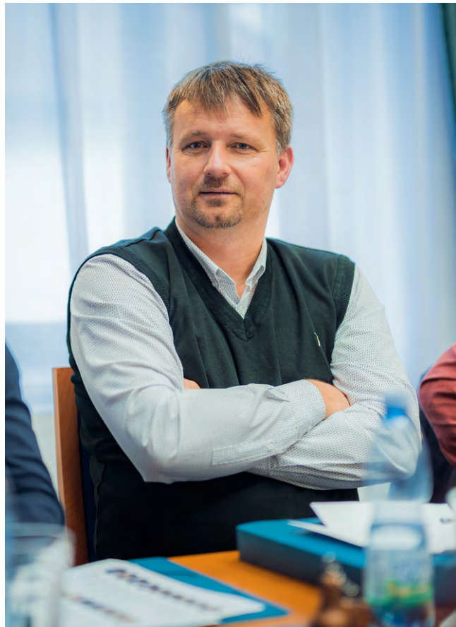
JAN KUCHAŘ, poslanec

Problémem českého zdravotnictví není nedostatek peněz za státní pojištěnce. Reálný problém, kterého si ale opozice nevšimá, je nedostatek zdravotního personálu. To nelze vyřešit zvýšením těchto plateb, ale jen a pouze investicemi do vzdělávání.