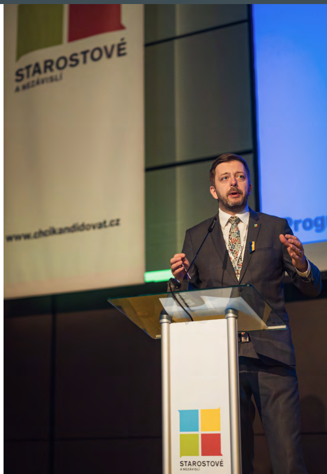
VÍT RAKUŠAN, předseda hnutí STAN, ministr vnitra

A děkuju i vám všem, kteří tohle čtete. Za to, že jste u toho s námi. Váš Vít Rakušan