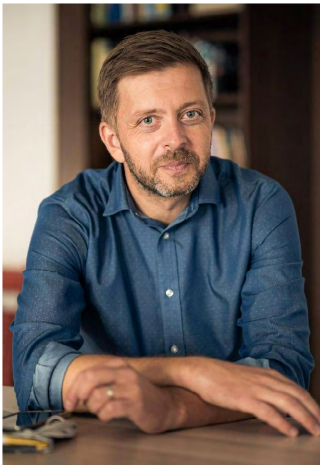
VÍT RAKUŠAN, předseda hnutí STAN