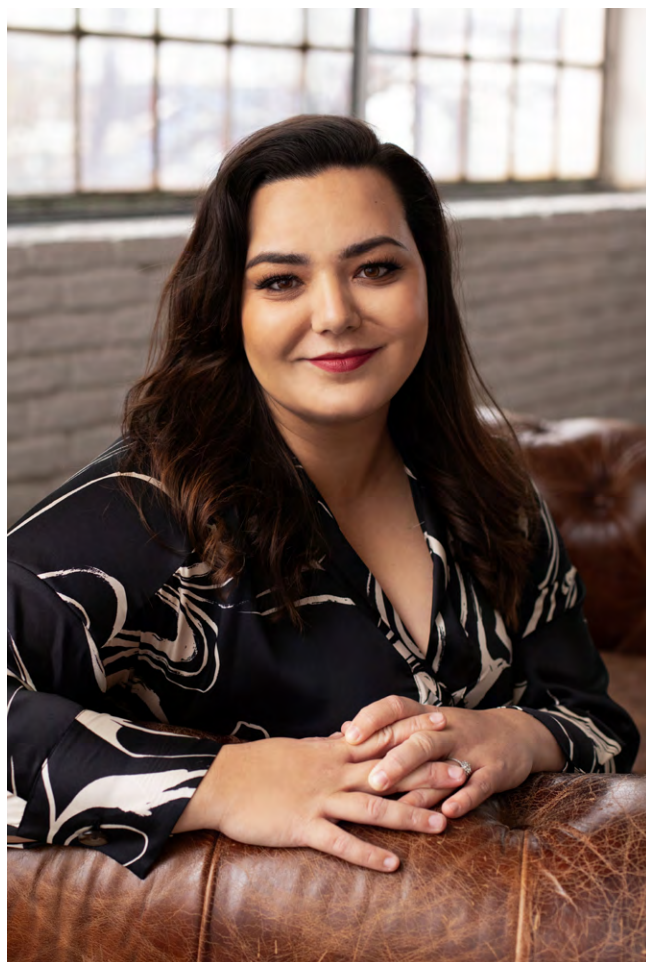
BARBORA URBANOVÁ, poslankyně

Já skutečným obětem chci pomoci. A udělám to tak, že budeme v rámci našeho Podvýboru pro domácí a sexuální násilí Poslanecké sněmovny pracovat na redefinici pojmu znásilnění, udělám to i tak, že rozšíříme pojem “domácí násilí”, aby pod něj