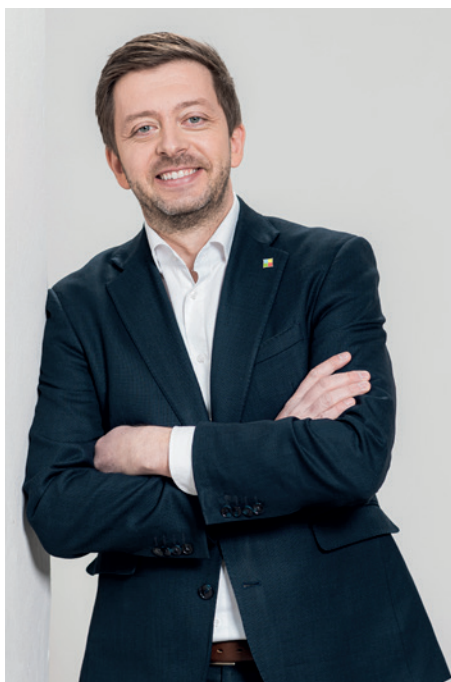
Vít Rakušan, předseda hnutí STAN