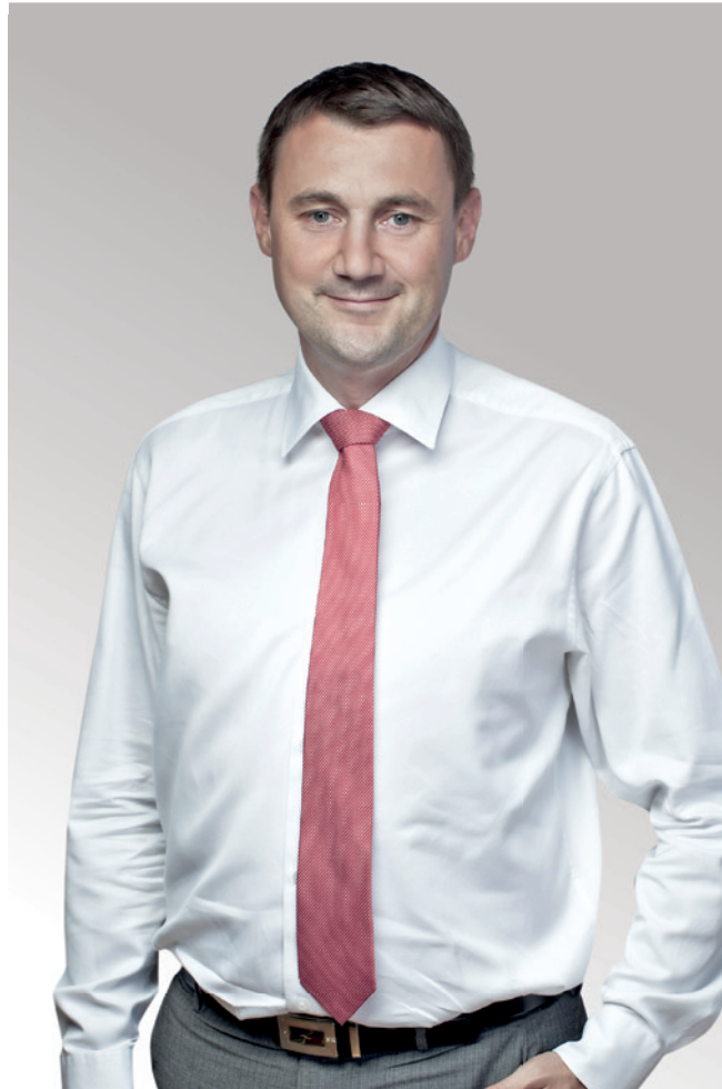
Martin Půta, hejtman Libereckého kraje

Vybudovali jsme silný tým, který drží pohromadě i v těžkých chvílích, ve kterých by to někteří lidé už zabalili. Starostové pro Liberecký kraj jsou lidé, kteří pracují ve svých obcích a městech a jsou za nimi vidět výsledky.