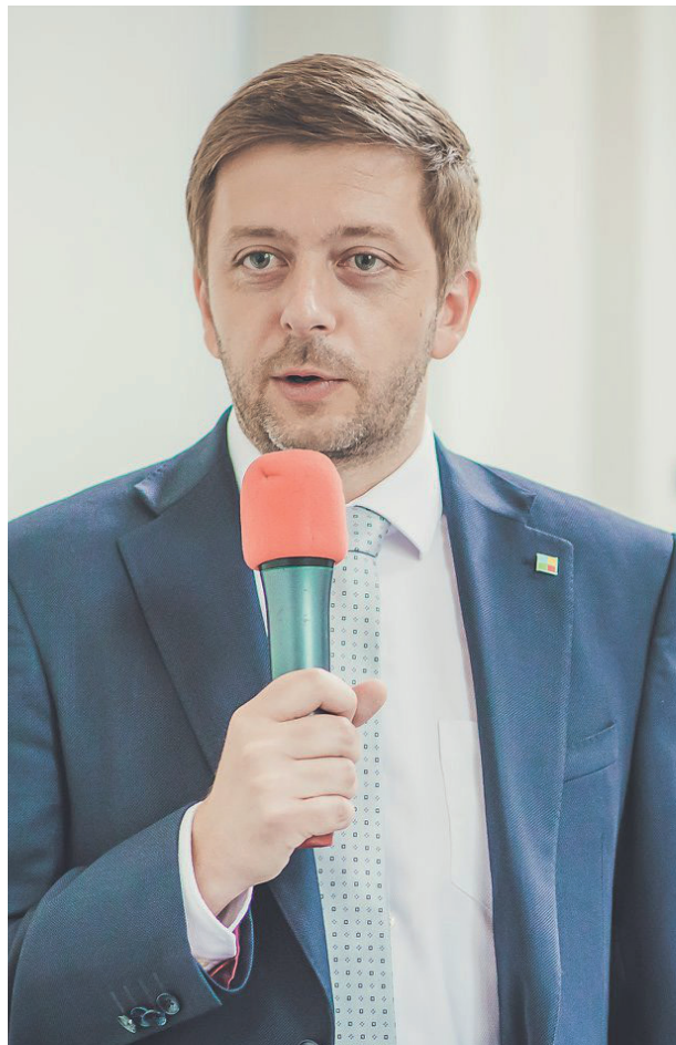
Vít Rakušan, předseda hnutí STAN

Z rozhovorů s lidmi na svých výjezdech se dozvídám, že to vypadá, jako by naše kroky vůči prezidentovi byly jen pomstou za to, že jsme nesouhlasili s jeho zvolením a chtěli jsme jiného prezidenta.