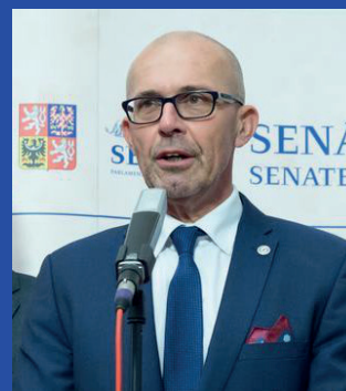
Petr Holeček, předseda senátorského klubu

Senátorky a senátoři klubu Starostové a nezávislí jsou velmi aktivní i v práci ve svých regionech a oblastech, ze kterých pocházejí. Navštěvují obce a pomáhají starostkám a starostům obcí s problémy, které jsou pro ně občas neřešitelné. Většinou jsou spojené - bohužel - s byrokracií a nezájmem státu či nadřazených orgánů. Zároveň se ale i podílejí na odborných konferencích a „kulatých stolech“, v Senátu pořádaných, ať už se týkají vzdělání či ochrany přírody, nebo na pomoci chudším regionům.