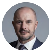
Josef Bernard (STAN), 56 let krajský náměstek pro oblast životního prostředí, zemědělství, evropských záležitostí a regionálního rozvoje, ekonom