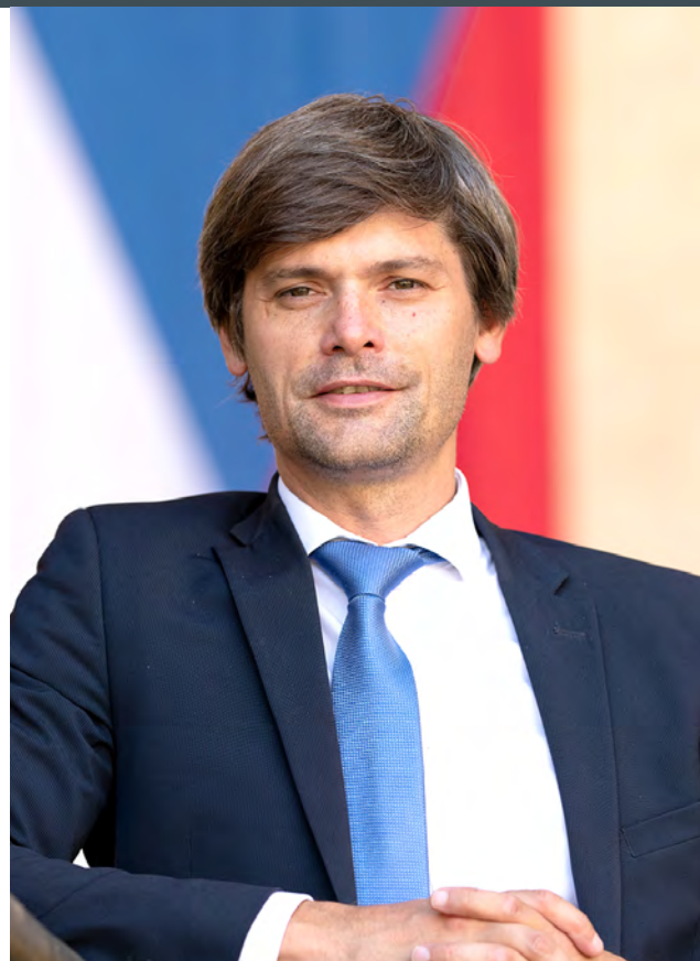
Marek Hilšer, senátor

Nelze ani přijmout argument, že občané trvale žijící v zahraničí nejsou přínosem pro naši zemi, tudíž by neměli mít možnost volit. Opak je pravdou. Právě oni jsou často ti, kdo reprezentují to