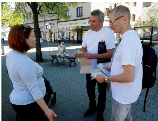
Na Den Země vyrazili členové STAN Spolu pro Benešov rozdávati Benešákům ekologické pytlíky na třídění bio-odpadu.

Co chceme změnit a za co bojujeme, jsou hnedé kontejnery na tříděný odpad dostupné všem občanům města. Zejména na sídlištích, protože tam lidé většinou nemají kam bio-odpad dávat. Podporujeme vznik městské kompostárny a komunitních kompostá-