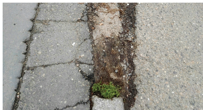
Takto rozbité chodníky najdete jen pár desítek či stovek metrů od benešovské radnice.