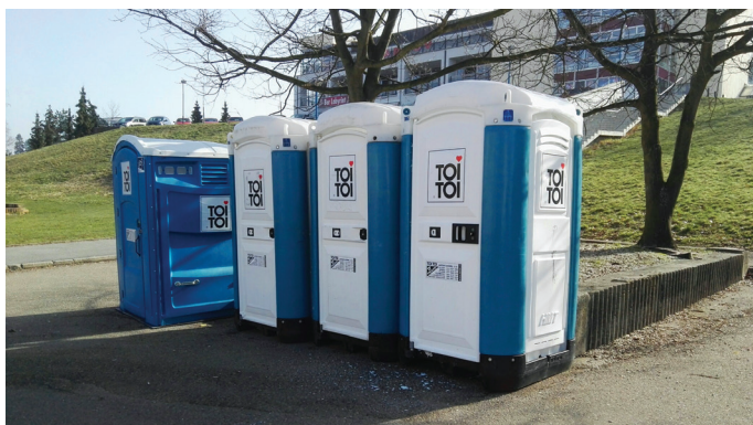
TOI-TOIky v centru města. Aneb když musíš, tak musíš (lepší něco než nic).

Sice je dobré mít občas hlavu v oblacích, ale většina z nás se častěji dívá na zem – tedy před sebe, kam šlape. Pokud se nyní v Benešově plánují velké investice, bylo by jen dobré, kdyby se pozornost věnovala i stavu chodníků. Mít ve městě kvalitní povrchy je základ, jinak to tu bude vypadat jak na poli. Lidé, a zdaleka nejen ti v seniorském věku, dnes porůznu škobrtají a zakopávají na polorozpadlých chodnících a obrubnících. Estetická stránka věci je neméně důležitá.