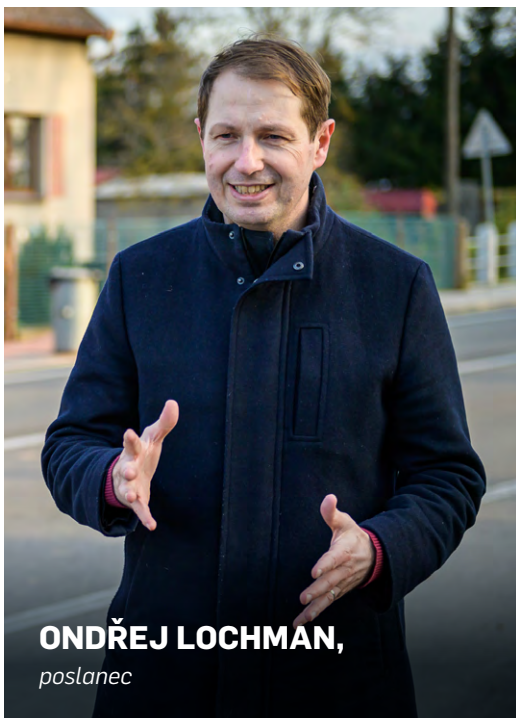
ONDŘEJ LOCHMAN, poslanec

Sněmovna schválila mnou předložený pozměňovací návrh, který má zefektivnit a zrychlit odstraňování nezákonně umístěných reklamních ploch podél silnic. Nově bude mít správce komunikací povinnost tyto reklamy bezodkladně odstranit.