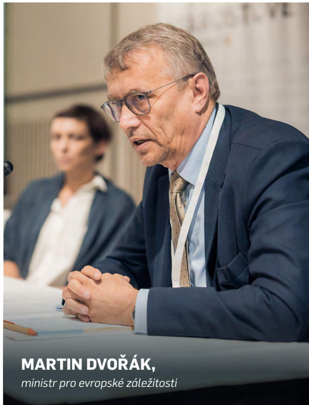
MARTIN DVOŘÁK, ministr pro evropské záležitosti

Navázat na tak zdařilé předsednictví bude výzva. Zároveň nám ale naše posílená reputace nabízí nové příležitosti a lepší vyjednávací pozici. Budu se proto snažit navázat a podpořit zapojení Čechů v evropských institucích. Na značce Česko a na hájení českých zájmů je potřeba pracovat neustále. Všechno, co se odehrává v Bruselu, se dříve nebo později promítá do života v Česku. My se musíme na evropském dění aktivně podílet, protože Evropa jsme my. Těším se na to.