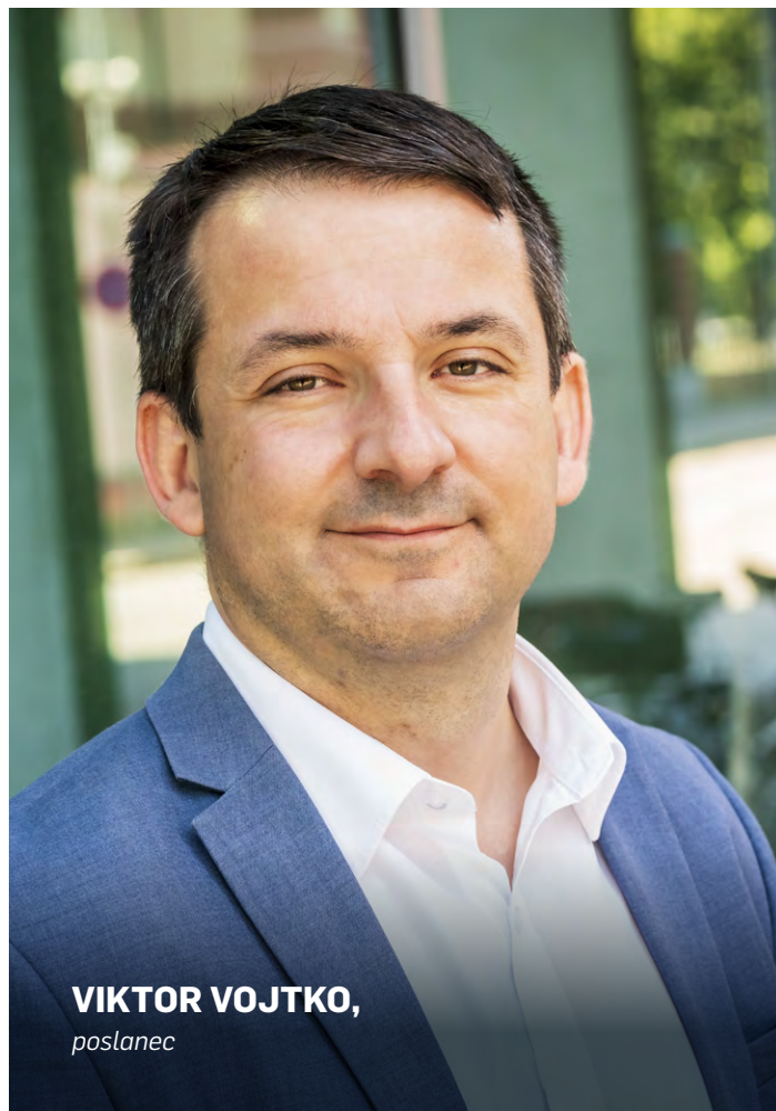
VIKTOR VOJTKO, poslanec

Jako STAN do budoucna podporujeme další významnější změny ve 3. pilíři a čeká nás v tom ještě kus práce. Nutná bude revize dalších podpor důchodového spoření a investování ze strany státu, chceme také motivovat k efektivnímu využití těchto prostředků na pravidelné příjmy v důchodovém či předdůchodovém věku.