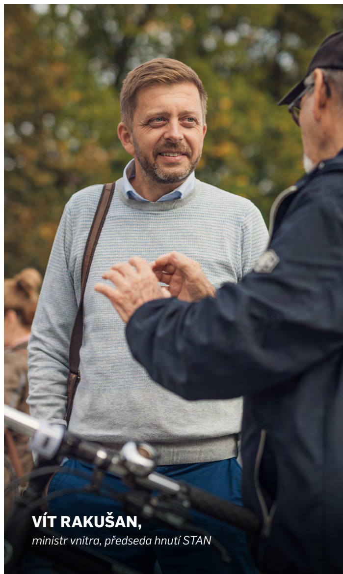
VÍT RAKUŠAN, ministr vnitra, předseda hnutí STAN

Radost mám ale i z řady dalších věcí z poslední doby, které ukazují, že jsme naši zemi nasměřovali správným směrem: rušíme tisíce nesmyslných právních předpisů, které zaplevelovaly náš právní systém, vypověděli jsme vazalské smlouvy z doby