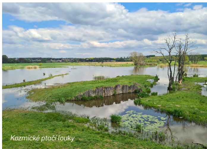
Kozmické ptačí louky

Jedná se o pár střípků z nekonečné mozaiky příkladů, jak bychom se k přírodě měli chovat a příroda nám to třeba v tomto případě ve formě kvalitní vody, která nám doma teče z kohoutků, vrátí.