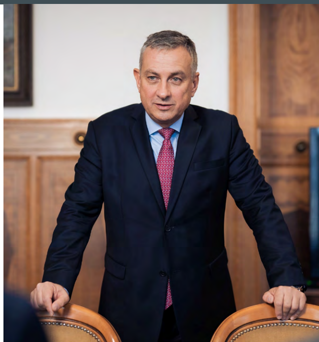
JOZEF SÍKELA, ministr průmyslu a obchodu

V žádném případě jsme ale nepodcenili ani druhou hrozbu, týkající se cen energií. Opět – naše situace není vůbec jednoduchá – minulá vláda za sebou nechala rekordní deficit. Loni zadlužila Českou republiku nejvíc ze všech zemí Evropské unie.