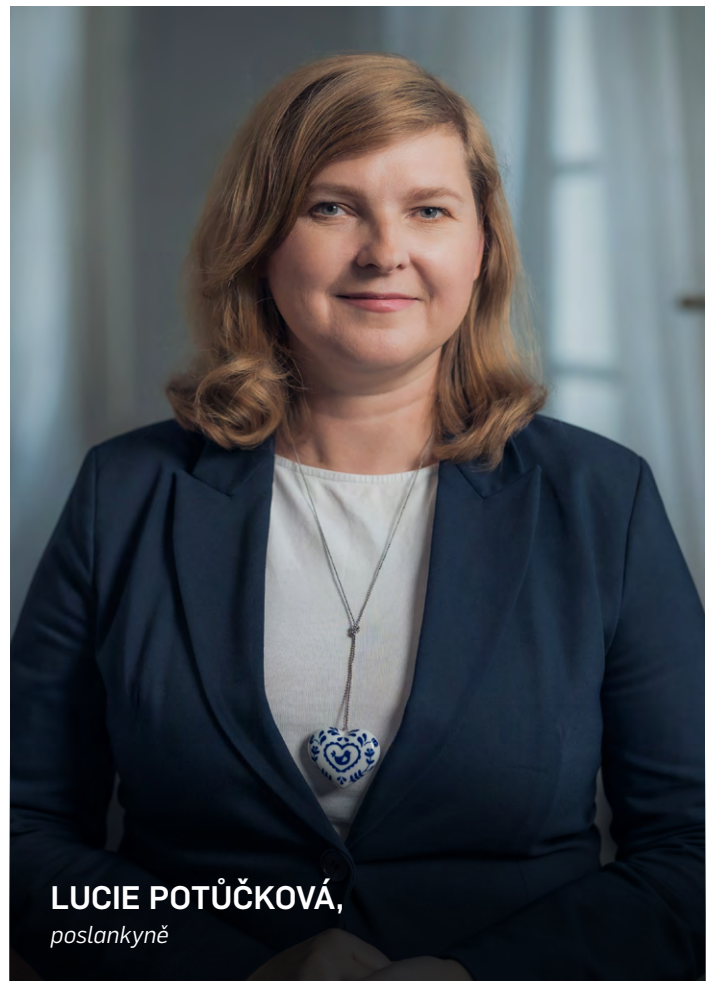
LUCIE POTŮČKOVÁ, poslankyně

Proč se tedy předkládá tento zákon? Tento zákon doplňuje prvky ochrany oznamovatelů, poskytuje záruku proti odvetným opatřením, ukládá povinnost určitým subjektům zřídit interní mechanismy. Kdo může podat oznámení? Zaměstnanci a osoby v podobném postavení. Kdo je povinným subjektem? V tomto případě subjekty soukromého i veřejného sektoru. Koho se povinnost zavedení vnitřního systému netýká?