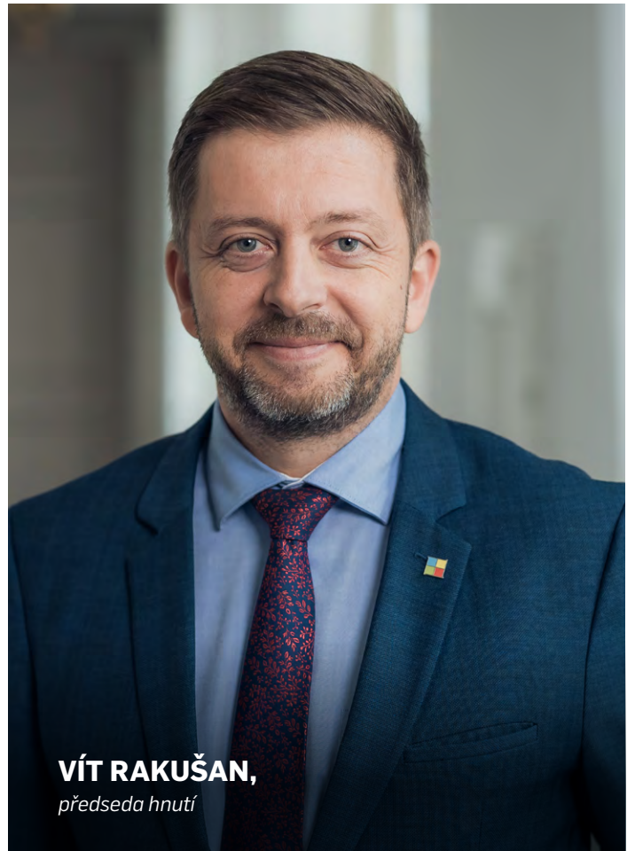
VÍT RAKUŠAN, předseda hnutí

Veřejné finance: s válkou souvisejí víc, než by se zdálo. Naše vláda nastoupila s tím, že chce rozvrácený státní rozpočet dát do pořádku. Úkol stejně nepopulární jako nezbytný. Válka a s ní související energetická krize a inflace nám do začátku nadělily roční zpoždění – v zájmu udržení základní společenské