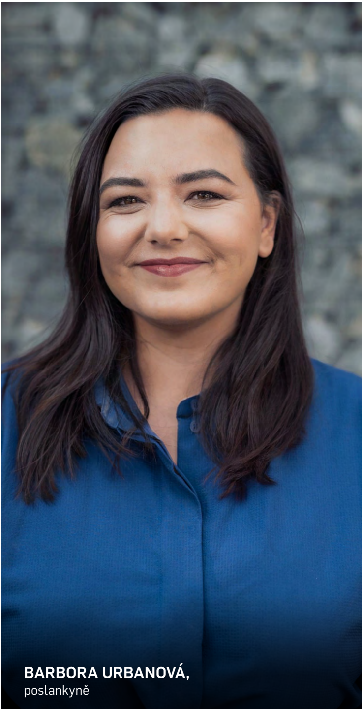
BARBORA URBANOVÁ, poslankyně

Poslanecká sněmovna odsoudila rozsáhlé útoky na ukrajinské civilní obyvatelstvo nebo klíčovou energetickou infrastrukturu. Stejně tak neuznává výsledky tzv. referend o připojení čtyř okupovaných oblastí na východě Ukrajiny. V souladu s rezolucí Parlamentního shromáždění Rady Evropy označila ruský režim za teroristický. Ruská agrese namířená právě proti civilistům je snahou o dosažení politických cílů zastrašením lidí a odpovídá teroristickým metodám. Přímé či nepřímé výhrůžky použitím jaderných zbraní, stejně tak jako falešná a nepodložená obvinění Ukrajiny z plánování použití zbraní hromadného ničení, jsou nebezpečnou eskalací napětí a hrozbou pro celoevropskou bezpečnost.