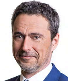
Miroslav Balatka, místopředseda výboru pro zahraniční věci, obranu a bezpečnost