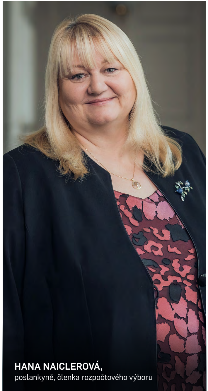
HANA NAICLEROVÁ, poslankyně, členka rozpočtového výboru