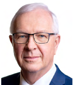
Jiří Drahoš, 1. místopředseda Senátu a organizačního výboru

Zároveň se chci ve větší míře věnovat i vedlejší roli výboru, což je připomínkování a schvalování rozpočtu Kanceláře Senátu včetně kontroly hospodaření s důrazem na efektivitu výdajů a zároveň i oprávněného nárokovaní zdrojů ze státního rozpočtu.“