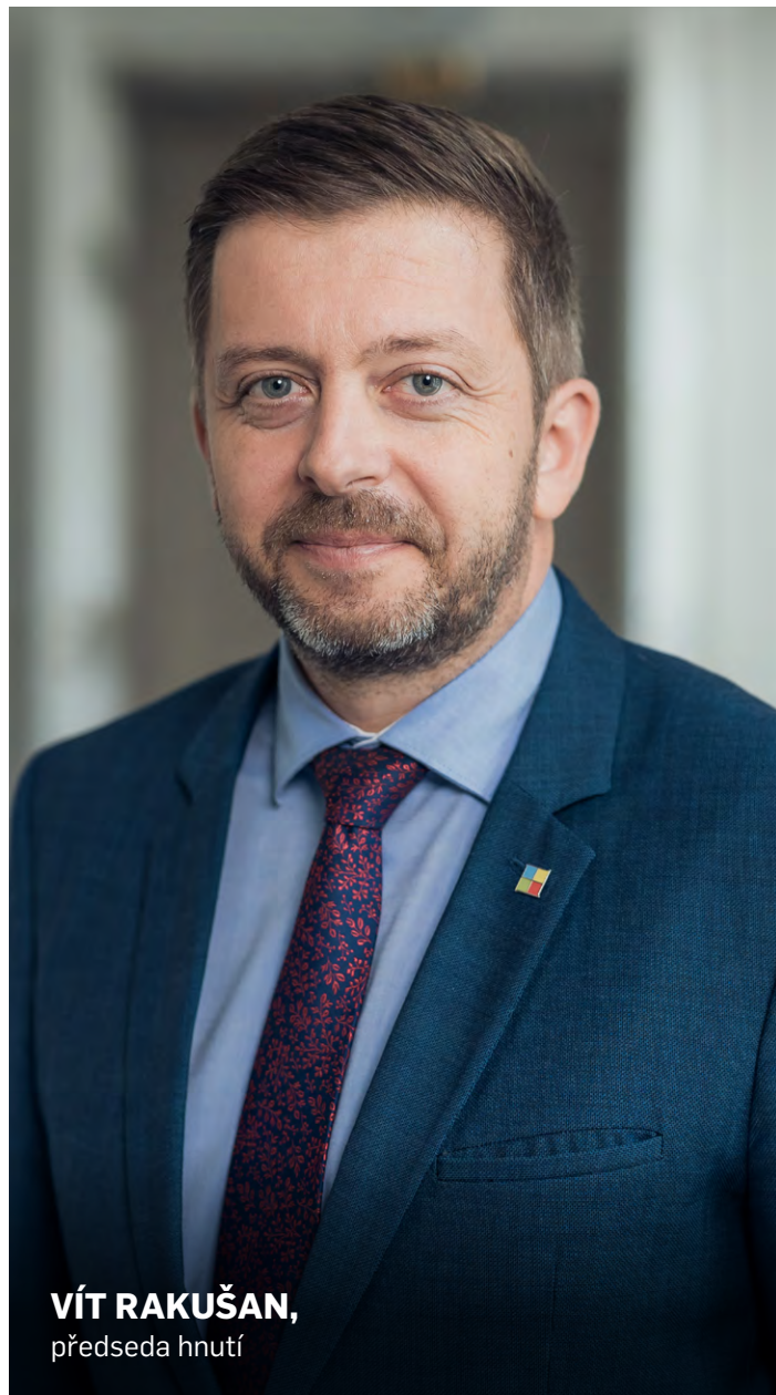
VÍT RAKUŠAN, předseda hnutí

víc času tady v ČR, v našich regionech, s našimi lidmi, s kolegy poslanci i se senátory, s vámi. Přestože jsem hrdý na to, jak česká vláda včetně zástupců STAN předsednickou roli zvládá, s radostí vyhlížím dobu, kdy budu moci čas, který mi dnes zabírá evropská agenda, věnovat Starostům a nezávislým. A je mi jasné, že po tom všem, co se nám v posledním roce podařilo dokázat i přestát, ten společný čas pro dialog, diskusi i obyčejná lidská setkání prostě potřebujeme. Těším se na něj – a na vás.