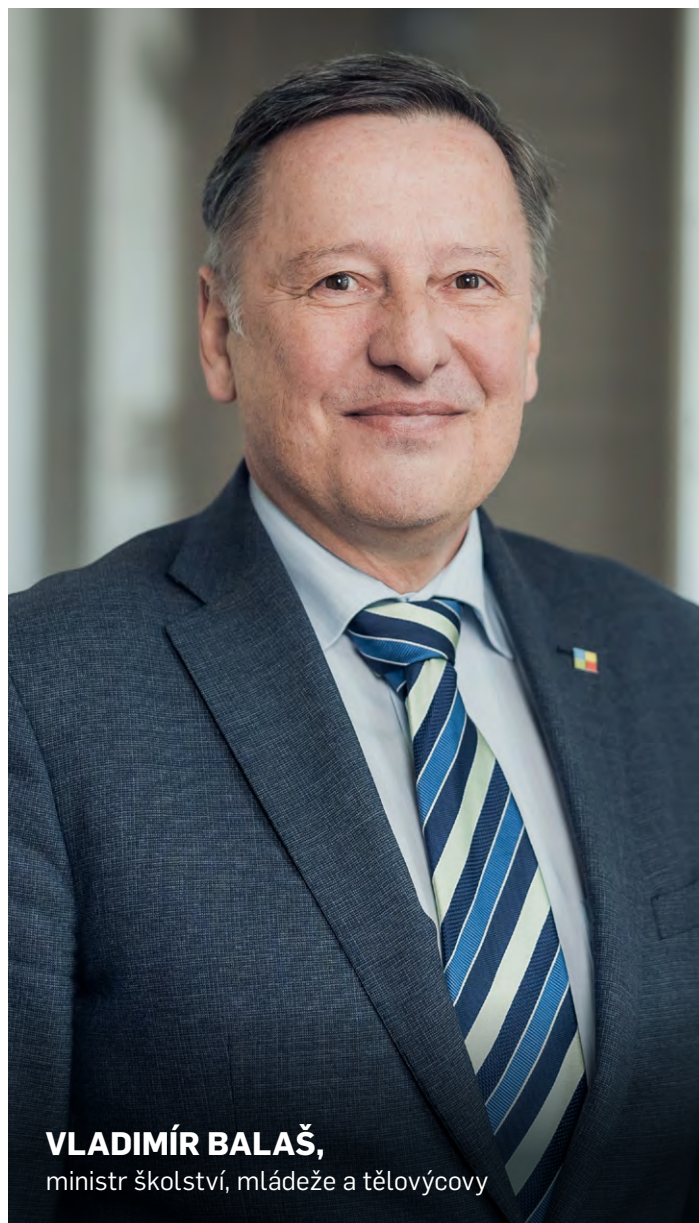
VLADIMÍR BALAŠ, ministr školství, mládeže a tělovýchovy