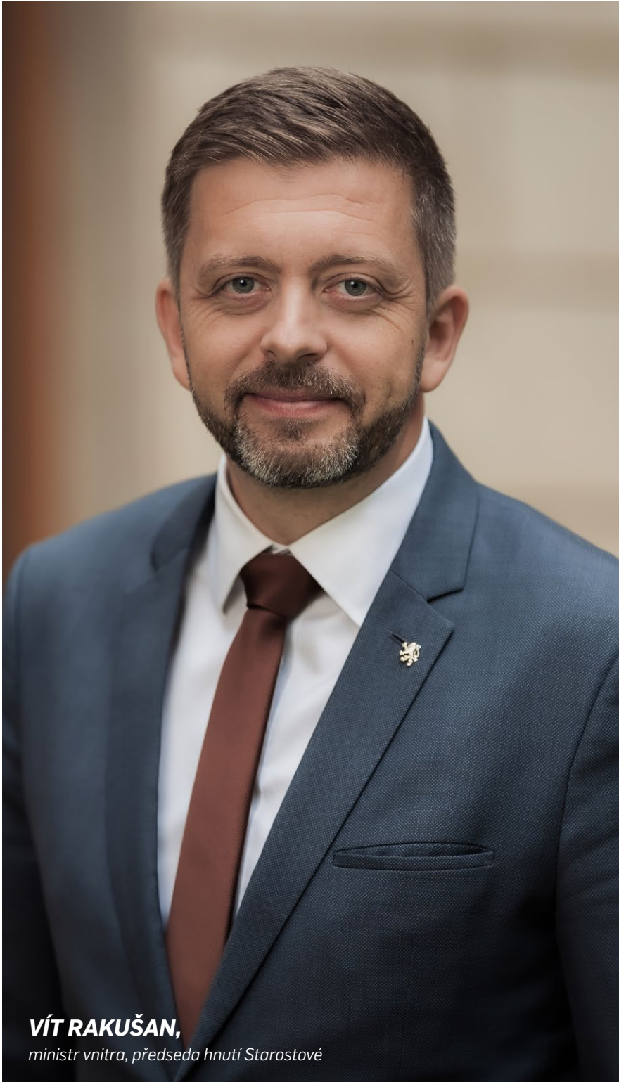
VÍT RAKUŠAN, ministr vnitra, předseda hnutí Starostové

Tomuhle projektu se dostalo řady hodnocení, od „je to jen marketing“ přes „využití frustrace“ a „kudla do zad koalice“ až po „živá voda vládní politiky“.