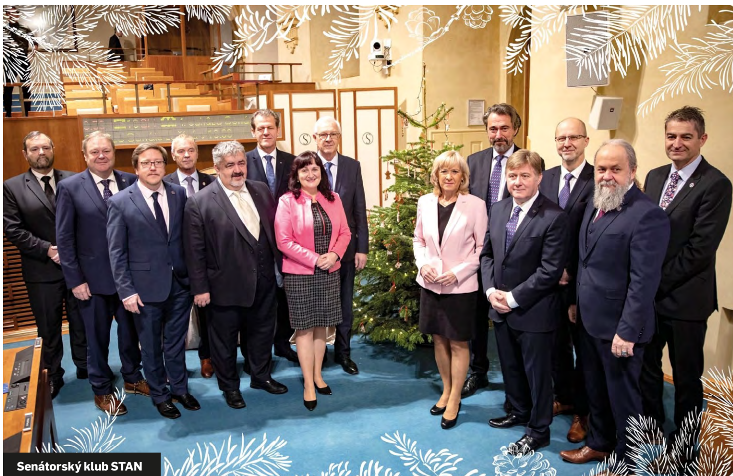
Senátorský klub STAN