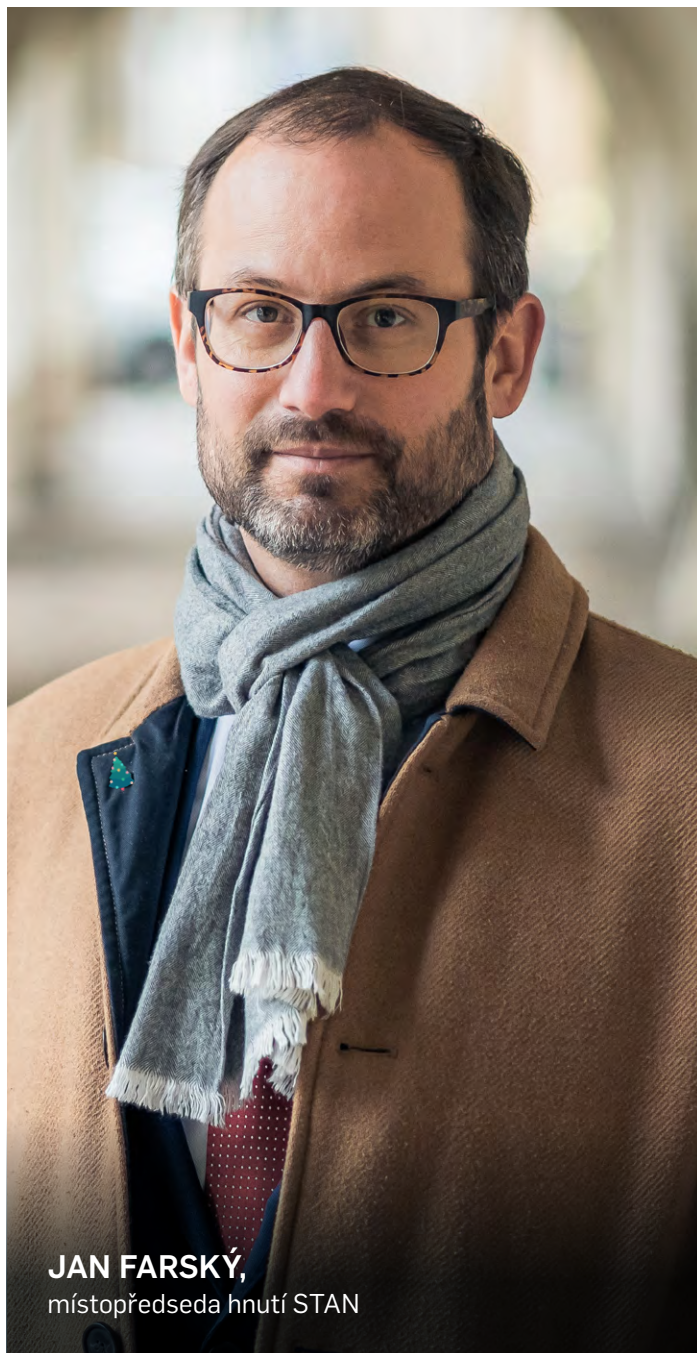
JAN FARSKÝ, místopředseda hnutí STAN