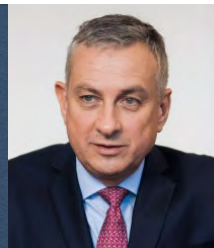
MPO, Jozef Síkela

Společně s kraji, obcemi a veřejností jsme se dokázali postarat o téměř půl milionu válečných uprchlíků z Ukrajiny. Ukázali jsme, že dokážeme být solidární a zásadoví.