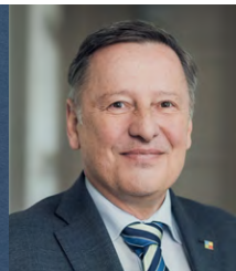
MŠMT, Vladimír Balaš

Byli jsme úspěšní v jednáních s Evropským parlamentem. V rámci balíčku Fit For 55 jsme se dohodli na přísnějších normách pro emise CO2 u nových osobních automobilů a dodávek.