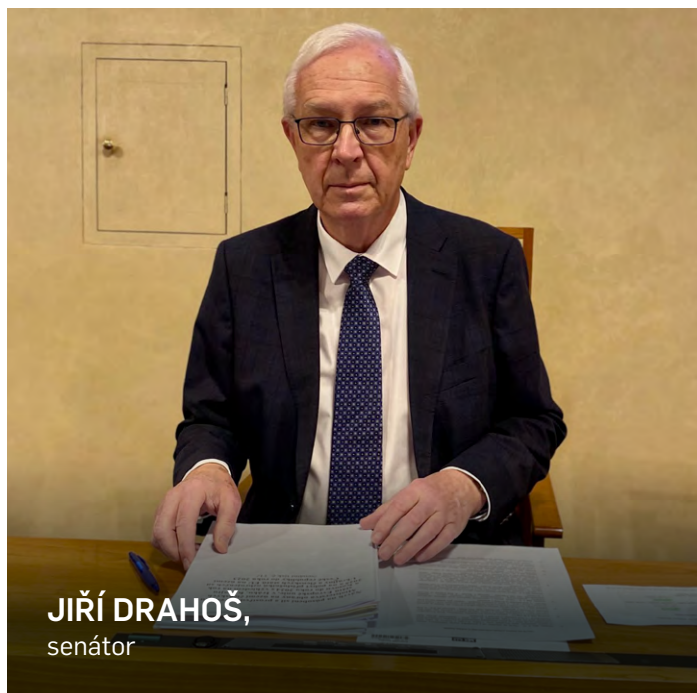
JIŘÍ DRAHOŠ, senátor

Dalším tématem, jemuž se nyní intenzivně věnuji, je spolupráce naší země s Tchaj-wanem. V září tohoto roku jsem na ostrov přivezl delegaci složenou například z odborníků na epidemiologii a kybernetickou bezpečnost. Hlavní diskuse se přitom týkaly polovodičů a možných souvisejících tchajwanských investic v České republice. Jsem velmi rád, že na závěr mé cesty bylo podepsáno memorandum o spolupráci, v němž nám tchajwanská strana nabídla financování magisterských a doktorských stipendií pro české studenty, kteří na Tchaj-wan pojedou studovat problematiku tzv. chytrých čipů. Ve spolupráci s MŠMT se nám vše podařilo dotáhnout do zdárného konce, takže první čeští studenti budou moci využít tyto prostředky již na podzim roku 2023. Ještě významnějším projektem je pak zájem tchajwanské strany zafinancovat u nás vznik výzkumného a vývojového centra pro polovodiče. Česká republika je příliš malou zemí na to, aby u nás vznikl celý výrobní závod na chytré čipy (zřejmě jedinou zemí v Evropě, v níž je to kapacitně možné, je Německo), na druhé