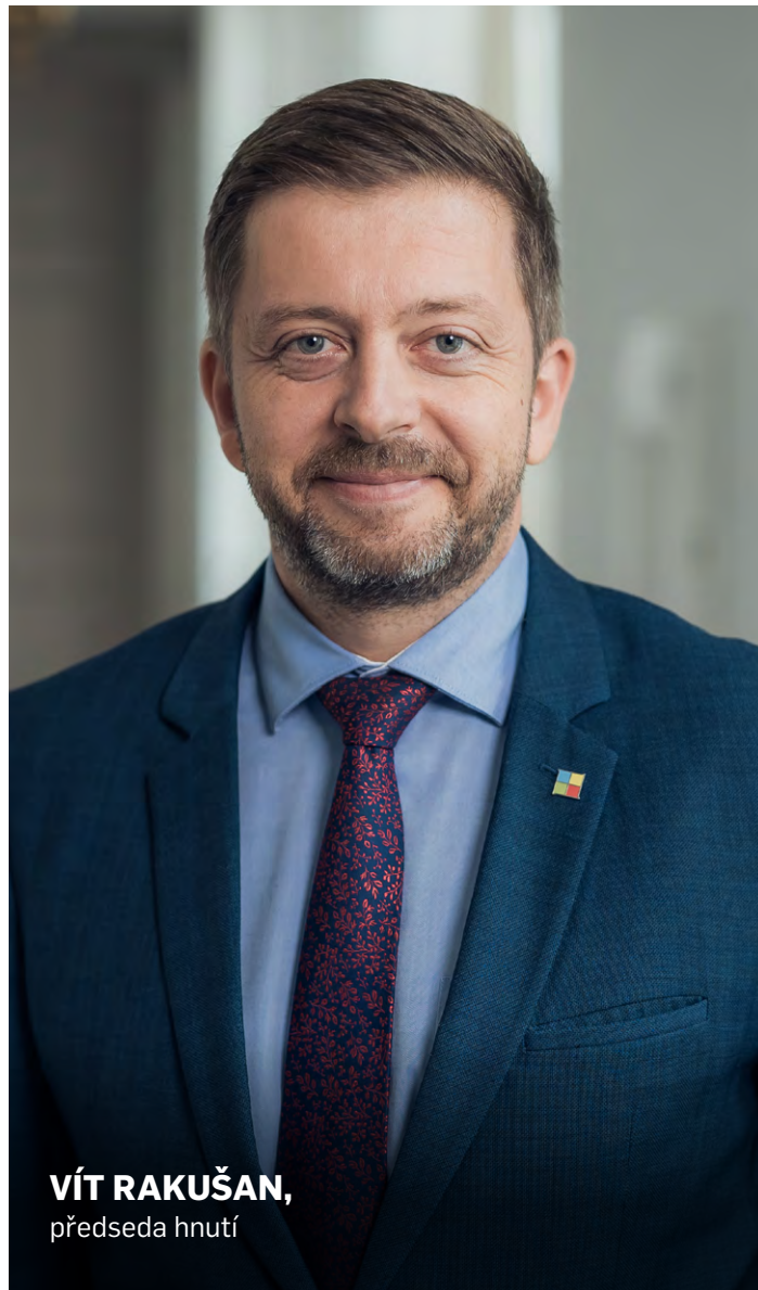
VÍT RAKUŠAN, předseda hnutí