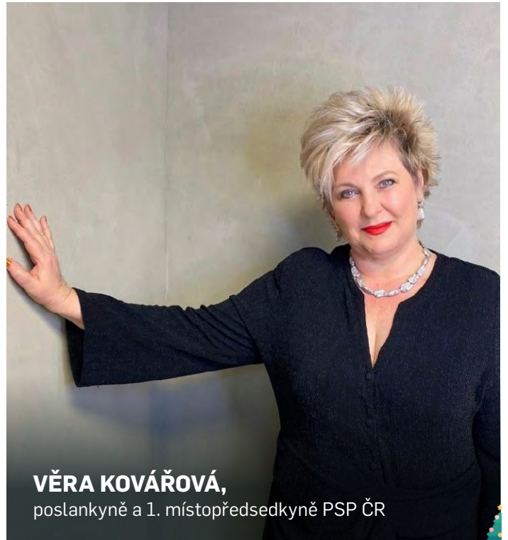
VĚRA KOVÁŘOVÁ, poslankyně a 1. místopředsedkyně PSP ČR

Zhoršená ekonomická situace dostala potravinové banky pod velký tlak, protože zájem o tuto formu pomoci výrazně vzrostl. Hodně jim pomáhá veřejnost při sbírkách potravin, pomáhají