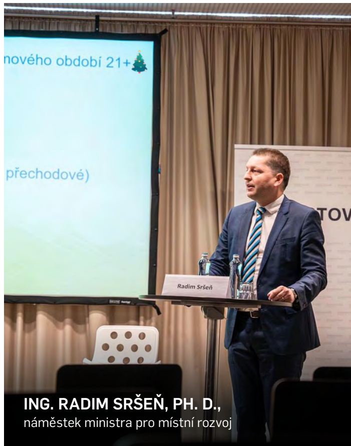
ING. RADIM SRŠEŇ, PH. D., náměstek ministra pro místní rozvoj

Nadále budeme připravovat nový Program rozvoje regionů 2024+, spolupodílet se na novém Programu pro podporu cestovního ruchu a Programu pro podporu bydlení.