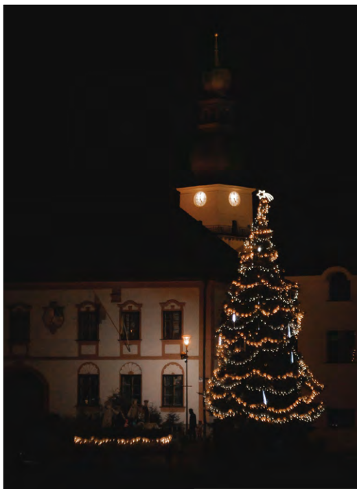
Žďár nad Sázavou