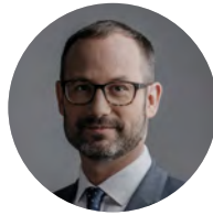
Mgr. Jan Farský (STAN), 42 let poslanec PČR, člen Ústavně právního výboru, právník