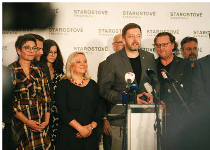
VÍT RAKUŠAN, předseda hnutí

Za neúspěch považuji jednoznačně senátní volby. Jejich výsledek zůstal za našimi očekáváními. Postavili jsme ve 14 ob-