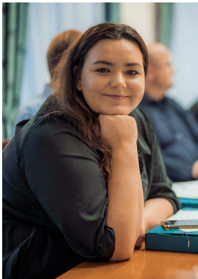
BARBORA URBANOVÁ, poslankyně

Člověk se musí soustředit trochu víc než normálně, ale protože jsem velmi rychlý psavec na mobilu i počítači, nepřipadám si tím zatížena, pokud mám hotovou jinou práci nebo nemám průběžně nějaké schůzky, rozhovory... co se týče toho vtipu, já se o něj snažím. Snažím se komunikovat a glosovat úplně stejně, jako si občas píšu s kamarády, se kterými vášeň pro politický bizár sdílím. Snažila jsem se ale taky čtenáře úplně nepřehlítit, aby to zůstalo „čtivé“, nebýt jen průtokáč informací, ale jejich moderátor. Vložit do toho svůj pohled a nějakou přidanou hodnotu, odpovědi na nejčastější dotazy. Chtěla bych to dělat