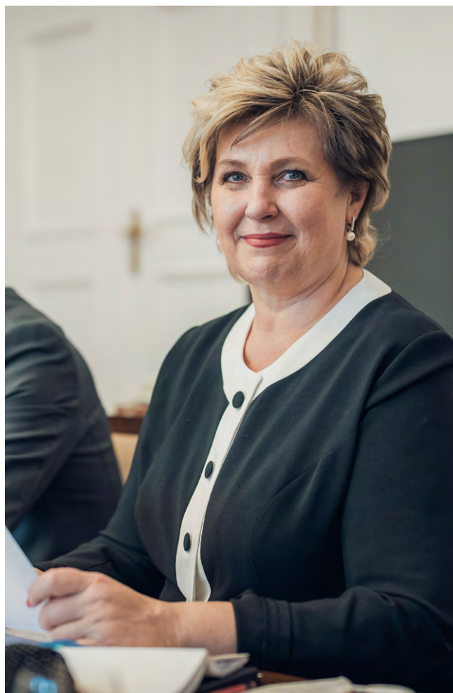
VĚRA KOVÁŘOVÁ, 1. místopředsedkyně Poslanecké sněmovny

„Dětské skupiny nabízejí řadu výhod, flexibilitu a pomoc s řešením nedostatečné kapacity mateřských škol,“ připomněla 1. místopředsedkyně sněmovny Věra Kovářová. „Na příkladech dobré praxe v mnoha městech, v nichž dětské skupiny fungují a osvědčily se, je vidět, že tato služba má smysl. Proto jsem ráda, že i MPSV