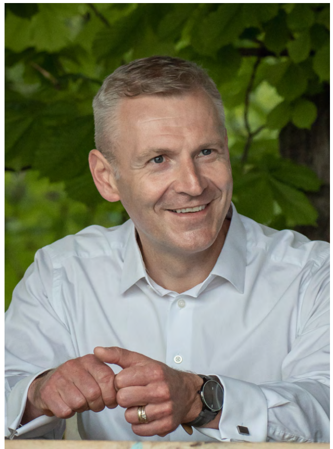
ZDENĚK HRABA, senátor

Myslím si, že pokud by tato nová úprava u nás pomohla, byt jedinému člověku, bude mít smysl. Nikdo z nás si asi nedokáže představit, jak těžké musí být několikaměsíční trestní řízení pro napadeného člověka, který to ve dvě ráno ve vlastním domě „přehnal“ s obranou ze strachu o své děti.