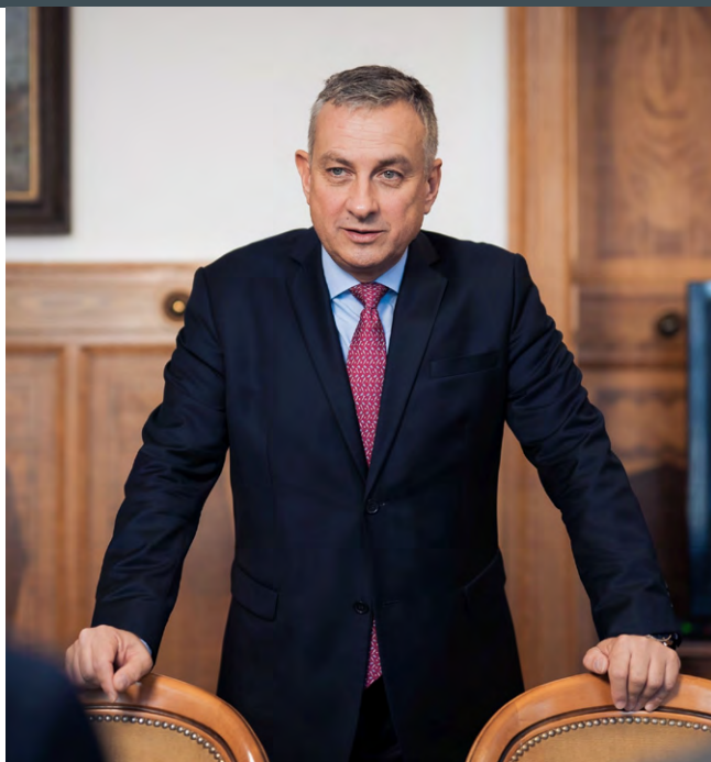
JOZEF SÍKELA, ministr průmyslu a obchodu

V žádném případě jsme ale nepodcenili ani druhou hrozbu, týkající se cen energií. Opět – naše situace není vůbec jednoduchá – minulá vláda za sebou nechala rekordní deficit. Loni zadlužila Českou republiku nejvíc ze všech zemí Evropské unie.