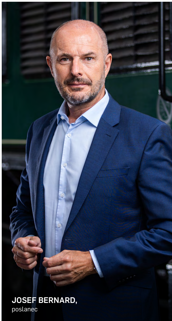
JOSEF BERNARD, poslanec

Vyrovnané veřejné finance a odpovědná fiskální politika jsou dále jedním z našich cílů. Je jen málo vyšších priorit než nezadlužovat budoucnost nás, našich dětí, této země. Proto nelze zavírat oči nad stavem veřejných financí jako takovým, neboť může mít na další generace skutečně výrazné dopady. Strukturální saldo, které vzniká bez ohledu na to, zda se ekonomice daří nebo ne, aktuálně činí kolem 220 miliard korun. Jakým způsobem obrátit negativní trend jeho prohlubování i s opatřeními, které pomohou české ekonomice, budeme debatovat ve zvláštní skupině iniciované Ministerstvem financí. Takové číslo se nedá odstranit zdánlivě jednoduchými škrty ve výdajích. Je potřeba hledat kombinaci různých opatření na příjmové i výdajové straně a experti našeho hnutí se na tom budou intenzivně podílet.