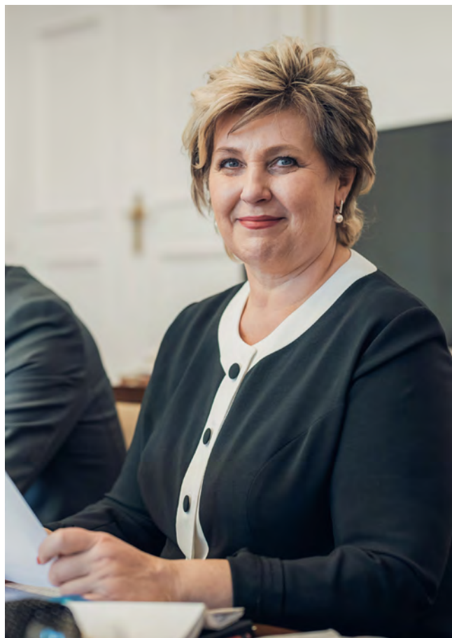
VĚRA KOVÁŘOVÁ, 1. místopředsdkyně PS, poslankyně

Těžký úkol, který s lehkostí odhodila předchozí vláda, hřmotně dopadl na hlavy vlády současné: ta navrhla odložit účinnost zákona a zavázala se, že do poloviny roku představí úpravu stavebního zákona, která zachová stavební úřady na místní úrovni. Co tento odklad přinese v praxi a jak bude stavební právo v mezitímní době fungovat? Stavby klíčové infrastruktury, jako jsou dálnice, železnice, letecké stavby, vodní nádrže, elektrárny apod., převezme Specializovaný stavební úřad. Všechny ostatní stavby pak budou nadále podléhat staré právní úpravě.