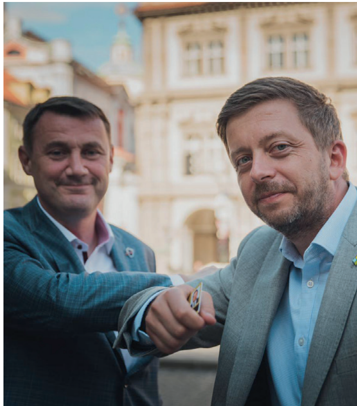
Martin Půta, hejtman Libereckého kraje Vít Rakušan, předseda hnutí STAN

Nečekat na rozsvícený semafor. Opatření přijímat i nad rámec celostátního semaforu. Předjímat situace. Monitorovat návraty z dovolených, větší akce a ohlídat, že právě ty jsou ze strany organizátorů zajištěné. Stejně tak volby budou znamenat větší riziko přenosu, proto musí být zajištěn dostatek testů pro členy