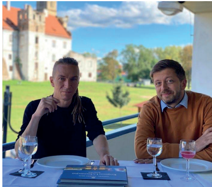
Ivan Bartoš, předseda České pirátské strany Vít Rakušan, předseda hnutí STAN

„Krajské volby ukázaly, že spolupráce politických stran má smysl, pokud funguje programová i lidská symbióza. Jsou signálem, že i voliči dokáží takovou koalici ocenit. Dlouhé měsíce jsem strávil rozhovory s ostatními předsedy opozičních stran, diskutovali