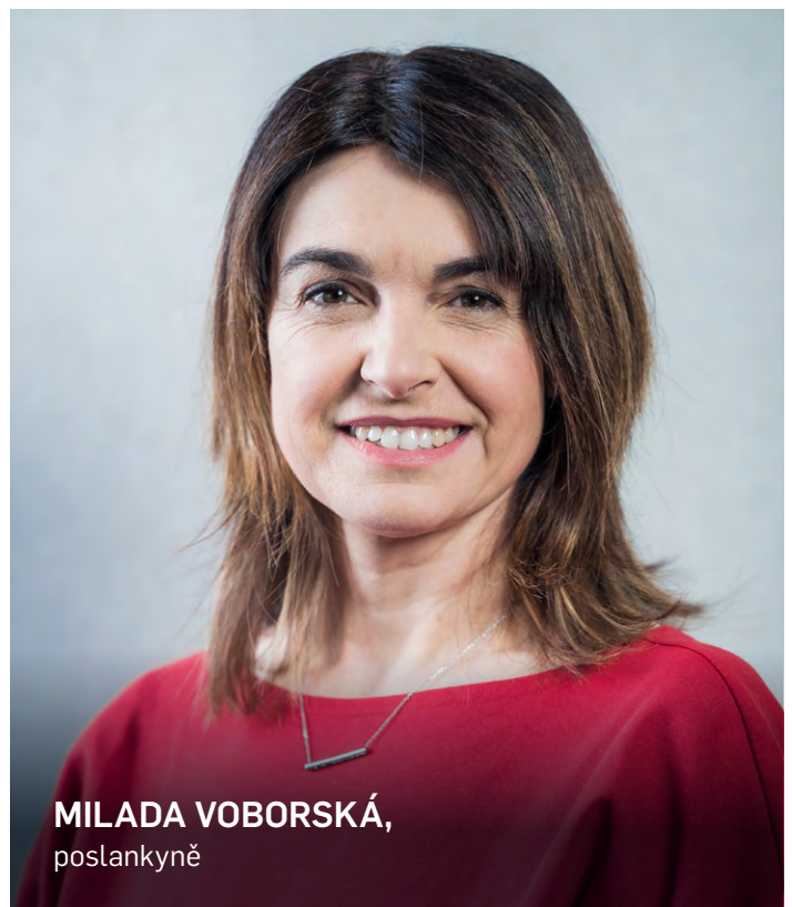
MILADA VOBORSKÁ, poslankyně

Ministerstvo financí na základě četných dotazů vypracovalo metodiku pro organizační složky státu a vybrané státní organizace s účinností od 1. července 2020 (MF-1341/2018/72-15). Taktéž ÚZSVM vytvořil Informační materiál pro obce a kraje, kde jednoduchou a přehlednou formou seznamuje samosprávné celky s problematikou hospodaření a nakládání s majetkem státu v režimu zákona č. 219/2000 Sb., o majetku České republiky a jejím vystupování v právních vztazích (ZMS). ÚZSVM pravidelně zveřejňuje přehled veškerých nemovitostí, s nimiž hospodáří, na svém webu www.uzsvm.cz , a také nabídky prostřednictvím aplikace