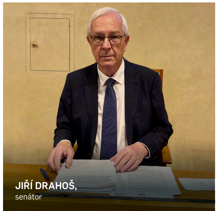
JIŘÍ DRAHOŠ, senátor

Dalším tématem, jemuž se nyní intenzivně věnuji, je spolupráce naší země s Tchaj-wanem. V září tohoto roku jsem na ostrov přivezl delegaci složenou například z odborníků na epidemiologii a kybernetickou bezpečnost. Hlavní diskuse se přitom týkaly polovodičů a možných souvisejících tchajwanských investic v České republice. Jsem velmi rád, že na závěr mé cesty bylo podepsáno memorandum o spolupráci, v němž nám tchajwanská strana nabídla financování magisterských a doktorských stipendií pro české studenty, kteří na Tchaj-wan pojedou studovat problematiku tzv. chytrých čipů. Ve spolupráci s MŠMT se nám vše podařilo dotáhnout do zdárného konce, takže první čeští studenti budou moci využít tyto prostředky již na podzim roku 2023. Ještě významnějším projektem je pak zájem tchajwanské strany zafinancovat u nás vznik výzkumného a vývojového centra pro polovodiče. Česká republika je příliš malou zemí na to, aby u nás vznikl celý výrobní závod na chytré čipy (zřejmě jedinou zemí v Evropě, v níž je to kapacitně možné, je Německo), na druhé