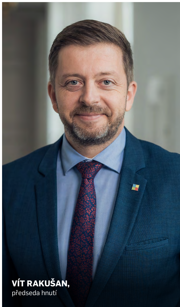
VÍT RAKUŠAN, předseda hnutí