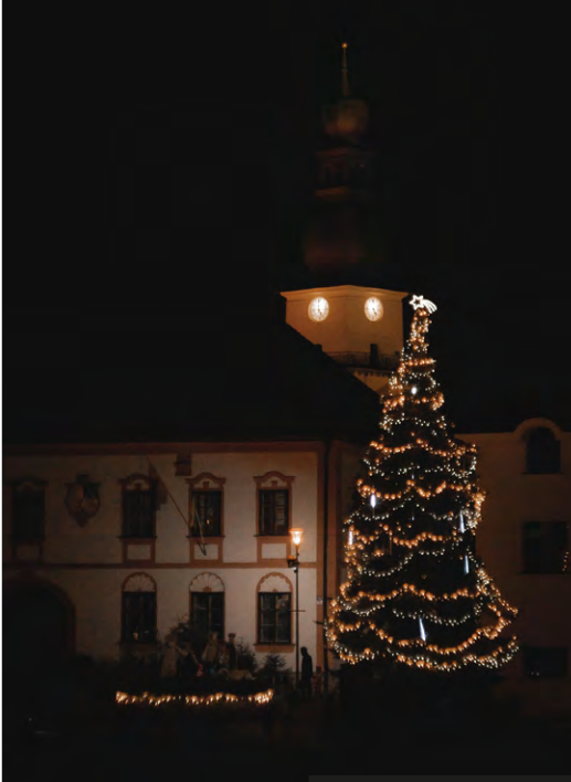
Žďár nad Sázavou