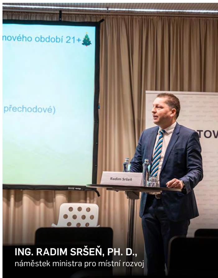
ING. RADIM SRŠEŇ, PH. D., náměstek ministra pro místní rozvoj

Nadále budeme připravovat nový Program rozvoje regionů 2024+, spolupodílet se na novém Programu pro podporu cestovního ruchu a Programu pro podporu bydlení.