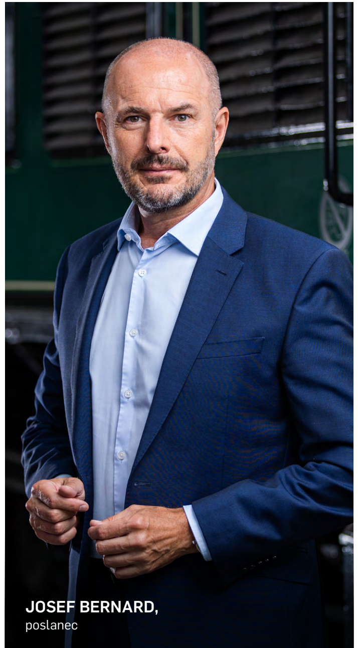
JOSEF BERNARD, poslanec

Vyrovnané veřejné finance a odpovědná fiskální politika jsou dále jedním z našich cílů. Je jen málo vyšších priorit než nezadlužovat budoucnost nás, našich dětí, této země. Proto nelze zavírat oči nad stavem veřejných financí jako takovým, neboť může mít na další generace skutečně výrazné dopady. Strukturální saldo, které vzniká bez ohledu na to, zda se ekonomice daří nebo ne, aktuálně činí kolem 220 miliard korun. Jakým způsobem obrátit negativní trend jeho prohlubování i s opatřeními, které pomohou české ekonomice, budeme debatovat ve zvláštní skupině iniciované Ministerstvem financí. Takové číslo se nedá odstranit zdánlivě jednoduchými škrty ve výdajích. Je potřeba hledat kombinaci různých opatření na příjmové i výdajové straně a experti našeho hnutí se na tom budou intenzivně podílet.