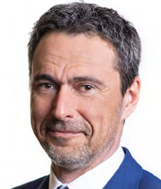
Miroslav Balatka, místopředseda výboru pro zahraniční věci, obranu a bezpečnost