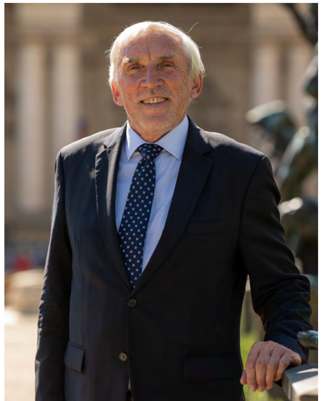
JIRÍ RŮŽICKA, 1. místopředseda Senátu PČR

Zmíněný zákon tato negativa řeší a umožňuje fungování škol bez nutnosti jejich celoplošného uzavírání. Je v zájmu nás všech, aby bylo žákům a pedagogům po co nejdéle dobu, pokud to pandemická situace dovolí, umožněno společně pracovat se získanými vědomostmi, společně řešit problémy, komunikovat, společně pracovat na projektech, tvořit, smát se či se dělit o zážitky s ostatními. Jsem rád, že si nově zvolená vláda, konkrétně ministr školství Petr Gazdík, uvědomila závažnost tohoto tématu a přišla s návrhem zákona, který bere v potaz nenahraditelnost společných zážitků, důležitost kontaktu s ostatními a rozvoj sociálních vazeb, které mají závažný vliv na vývoj každého jednotlivce a tedy celé společnosti.