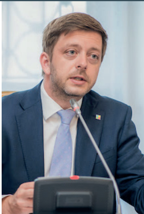
Vít Rakušan, předseda hnutí STAN

Ruská propaganda využije vždy každou maličkost, díky které může živit myšlenku, že Evropani, konkrétně Češi, jsou frustrováni současnou situací a chtějí změnu. A že takovou změnou mohou být právě komunisté a jejich spásou Rusko. Považuji to za vážný prohřešek, kterého by se neměl dopouštět žádný ústavní činitel, natož první místopředseda sněmovny. I proto vznikla iniciativa za jeho odvolání, a rovněž iniciativa, že se sněmovna distancuje od Filipových nedůstojných vyjádření a postojů. Rusové musí slyšet, že nejsme jejich gubernií, jakkoli ruské agentury naše slova zpochybní a překroutí, a svým občanům je náležitě přežvýkají v tolerovaných mezích. Přesně takhle to s námi dělali komunisti před rokem 1989 a snaží se nás zase pokoutně ovládat.