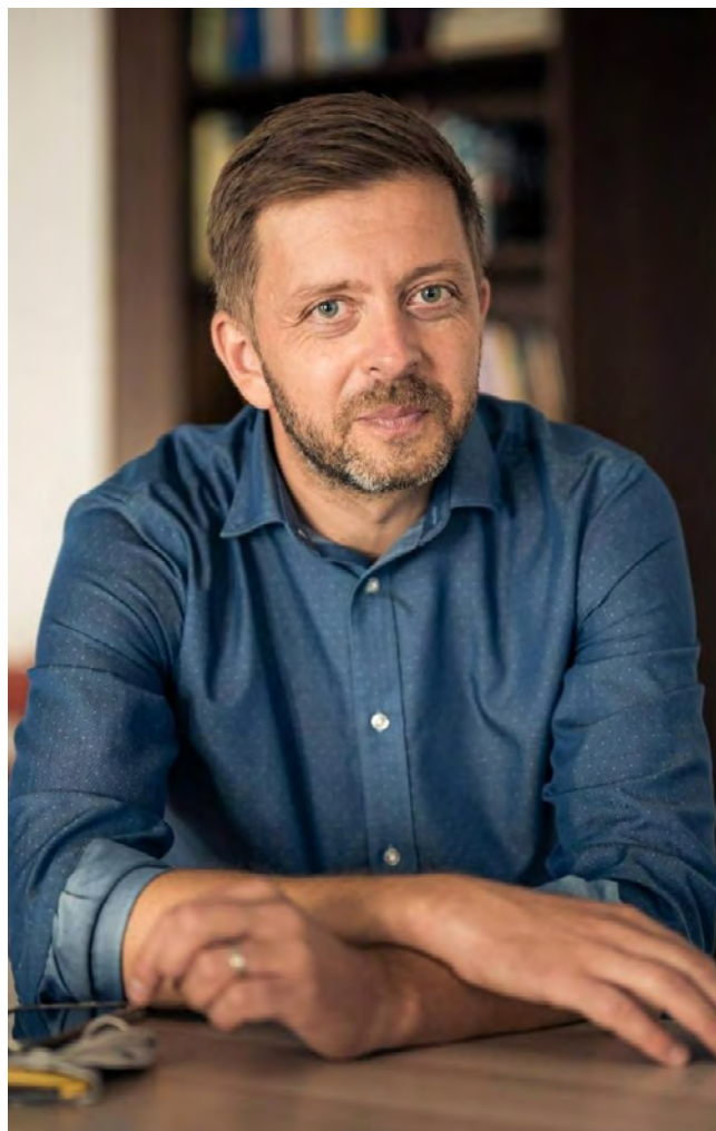
VÍT RAKUŠAN, předseda hnutí STAN, ministr vnitra

Za chvíli začneme být unaveni, začnou se objevovat problémy. Snažím se proto dívat dopředu. Vím, že problém budou dezinformace, nenávisť k lidem, kterým se teď všichni tak moc snažíme pomoci. Ubraňme se tomu. Ubraňme před tím hlavně je, nedělejme z nich oběti našich vlastních problémů.