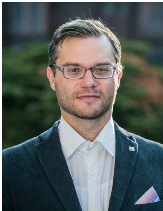
STANISLAV POLČÁK, europoslanec

„Po pečlivém zvážení všech okolností jsem se také rozhodl rezignovat na funkci místopředsedy hnutí STAN. Jsem si totiž vědom, že nepravdivá teze – provize za zákon – velmi poškozují naše hnutí, jehož dobré jméno a práce mých kolegů mi vždycky ležela nejvíce na mysli,“ vysvětlil svoje rozhodnutí Polčák.