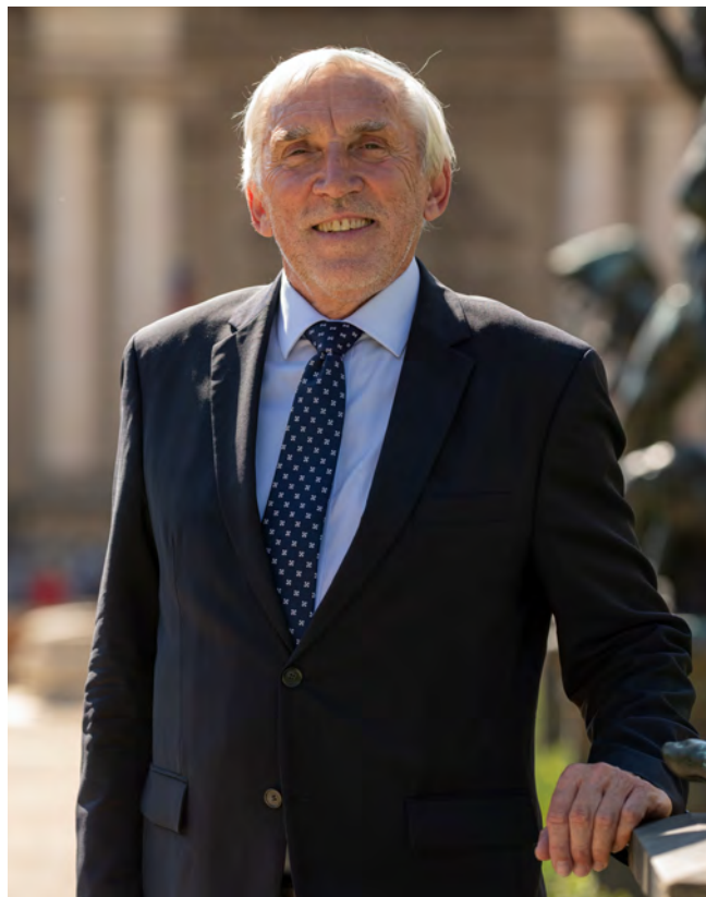
JIRÍ RŮŽICKA, 1. místopředseda Senátu PČR

Zmíněný zákon tato negativa řeší a umožňuje fungování škol bez nutnosti jejich celoplošného uzavírání. Je v zájmu nás všech, aby bylo žákům a pedagogům po co nejdéle dobu, pokud to pandemická situace dovolí, umožněno společně pracovat se získanými vědomostmi, společně řešit problémy, komunikovat, společně pracovat na projektech, tvořit, smát se či se dělit o zážitky s ostatními. Jsem rád, že si nově zvolená vláda, konkrétně ministr školství Petr Gazdík, uvědomila závažnost tohoto tématu a přišla s návrhem zákona, který bere v potaz nenahraditelnost společných zážitků, důležitost kontaktu s ostatními a rozvoj sociálních vazeb, které mají závažný vliv na vývoj každého jednotlivce a tedy celé společnosti.