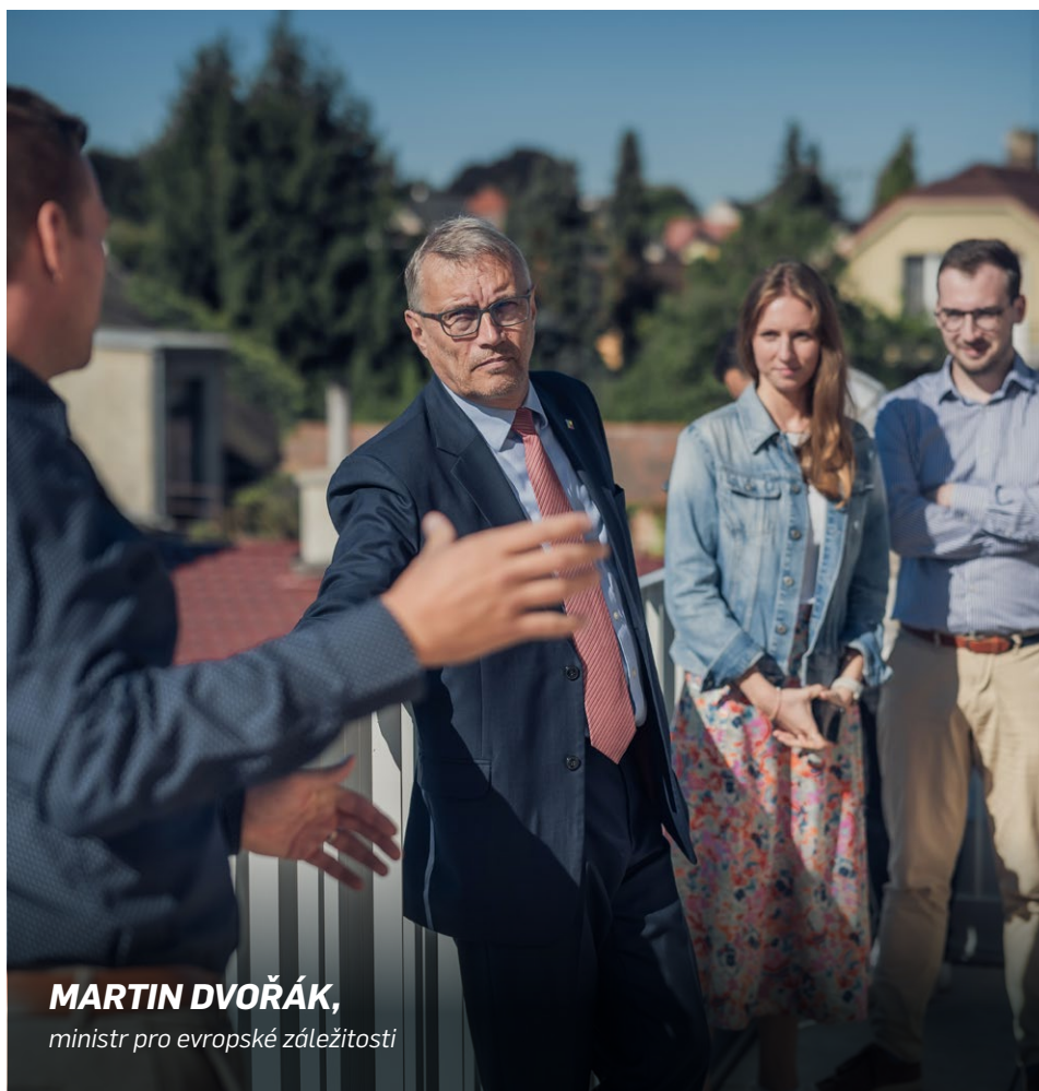
MARTIN DVOŘÁK, ministr pro evropské záležitosti

No a nemůžu vynechat ani otázku eura. Po letech se s ní podařilo rozvířít stojatý rybníček české politiky a dostala se do popředí veřejné diskuze. Jmenováním zmocněnce jsme otázku eura posunuli víc, než co se podařilo za uplynulých dvacet let. Máme teď jasné termíny a úkoly, pokud jde o směřování ke společné měně. I když se tento krok setkal se spoustou kritiky, pomohl udržet veřejnou diskuzi o euru a zajistil nám ekonomickou a legislativní analýzu přijetí eura. Ty se budou projednávat koncem roku na vládě. A to je velký krok vpřed!