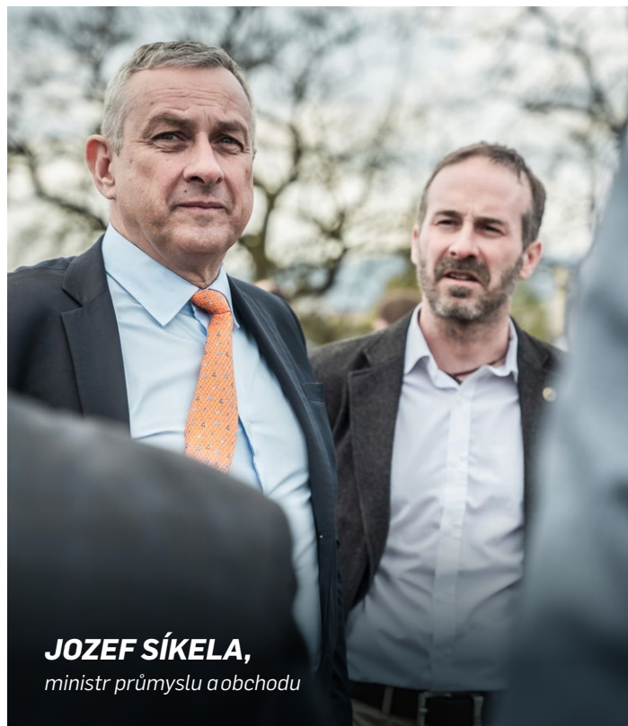
JOZEF SÍKELA, ministr průmyslu a obchodu

Kromě obnovitelných zdrojů bude stát výroba elektřiny na jádru. Proto intenzivně pracujeme na výstavbě nových jaderných zdrojů. Smlouvy s budoucím dodavatelem chceme mít připravené do konce března příštího roku. Energetika je složitá oblast, kde jednoduchá řešení neexistují. Proto je třeba hledat ta funkční, která zajistí pro občany a podniky dostatek energií za dostupné ceny. A na tom pracuji.