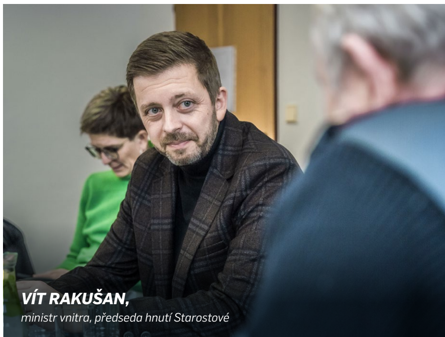
VÍT RAKUŠAN, ministr vnitra, předseda hnutí Starostové

Mým úkolem a cílem je posunout Ministerstvo vnitra a jeho agendu do 21. století. Z ministerstva represe vybudovat ministerstvo bezpečí, které pečuje o vnitřní bezpečnost České republiky a je stabilním prvkem v zajišťování bezpečnosti našich občanů. Z ministerstva, které svou budovou ze 40. let minulého století bude jen klamat tělem, a stane se moderním a přívětivým úřadem, který občany zbytečně nezatěžuje a v potřebných chvílích jim je ku pomoci. Ministerstvo plné bezpečnostní agendy transformovat do nositele digitalizace a efektivizace veřejné správy, modernizace legislativy a vstřícného přístupu k měkkým tématům. Z nepružného ministerstva vytvořit resort, který dokáže rychle reagovat na aktuální hrozby a je schopný jim dlouhodobě a udržitelně čelit. To je ministerstvo, které chci na konci svého funkčního období vidět.