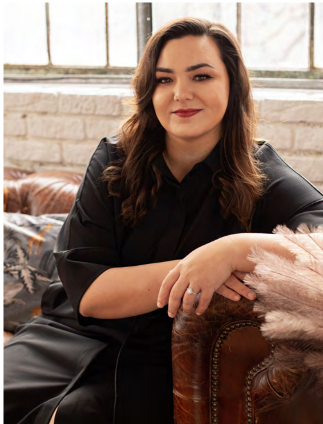
BARBORA URBANOVÁ, poslankyně

Také ale nechci být političkou, která navrhuje věty do zákonů, které říkají, že se něco nesmí, a vůbec neřeší systém, souvislosti celého problému. Debata o tom, zda má či nemá být trestné dát “výchovný” pohlavek dítěti, je totiž velmi zjednodušená a vůbec neřeší, proč každé desáté dítě v naší zemi zažívá násilí ve své rodině. Proto chci, a budu o to usilovat i v rámci své činnosti Podvýboru pro problematiku domácího a sexuálního násilí, legislativně řešit domácí násilí, poprvé koncepčně a v souvislostech. V českém právním řádu není sjednoceno, co vše je domácí násilí a co nikoliv. Úpravu ochrany před domácím násilím najdete v nejméně 14 zákonech, které samozřejmě nevznikaly současně, už vůbec ne koordinovaně a tak vytváří chaos, rozmělnění odpovědnosti. Rozhodně nepřispívají k účinné, rychlé a efektivní pomoci, kterou oběti potřebují. Trestní zákoník definici domácího násilí postrádá zcela. To se musí řešit, inspirací nám může být podle odborníků např. skotská úprava definice domácího násilí.