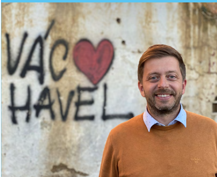
Vít Rakušan, předseda hnutí