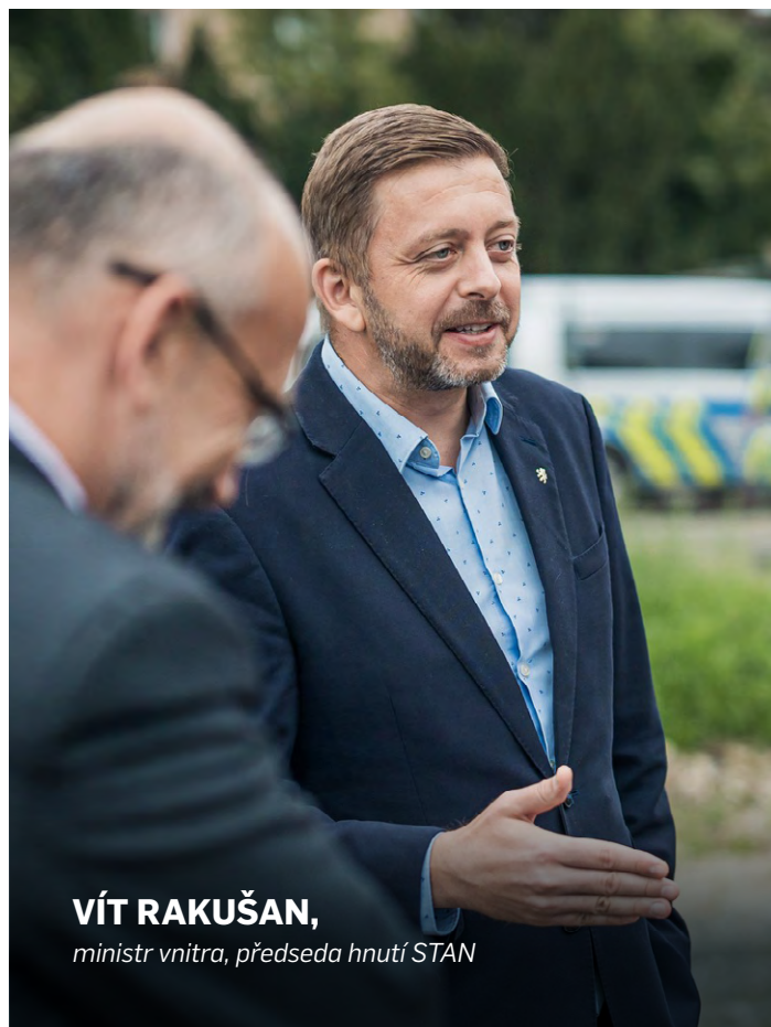
VÍT RAKUŠAN, ministr vnitra, předseda hnutí STAN

K tomu, abychom se domluvili, je ale potřeba mluvit „stejným jazykem“. A tady vidím největší úskalí jakékoliv domluvy stávající koalice a opozice. Mluvíme sice všichni (více méně) česky. Ale to nestačí. Musíme také stejnými slovy označovat stejné pojmy. A my teď nejsme schopni se shodnout ani na tom, jestli u nás momentálně je, či není „totalita“, ať už „nová“, „fialová“ nebo jakákoliv jiná. Pokud se budeme takhle zásadně mýjet s některými významnými představiteli opozice v porozumění základním pojmům, bude se bohužel účinkem mýjet úsilí o udržitelná, konsensuální řešení pro tuhle zemi.