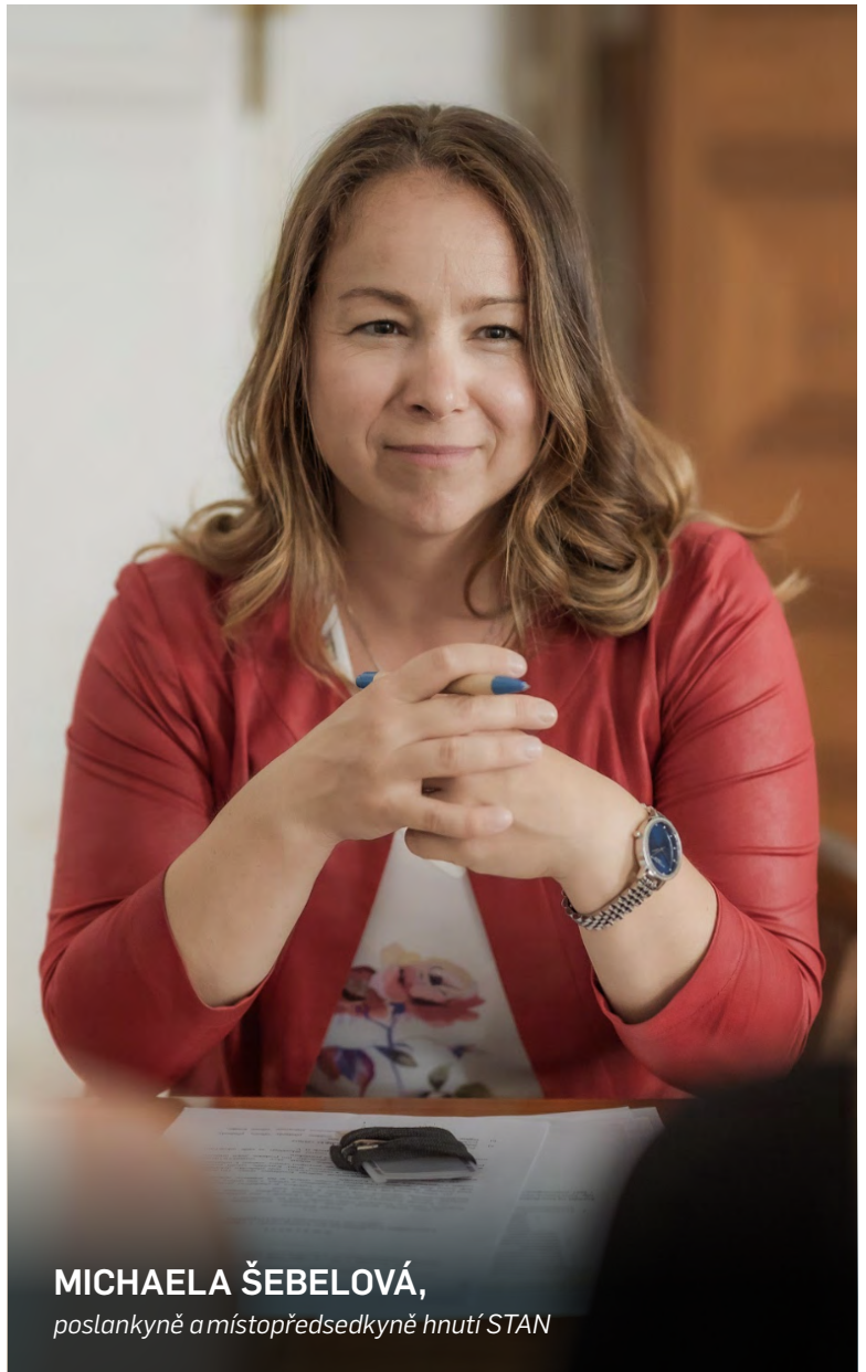
MICHAELA ŠEBELOVÁ, poslankyně a místopředsedkyně hnutí STAN

Účast a angažovanost poslanců a pracovníků Kanceláře Poslanecké sněmovny v rámci akce i připravené výzvy může představovat zdroj inspirace nejen pro všechny, kteří podporují aktivní životní styl v České republice. Iniciativa Aktivní září má za cíl podporu zdravého ži-