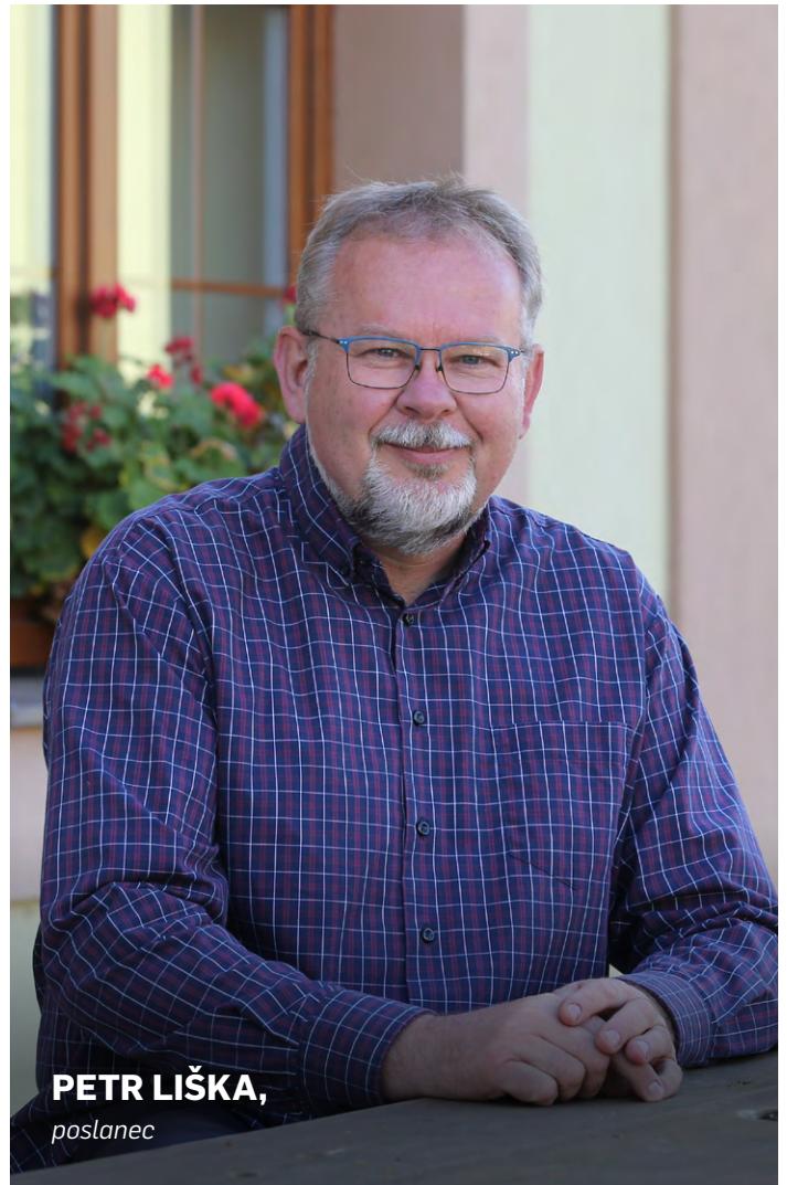
PETR LIŠKA, poslanec

Proto jednám s kolegy ve Sněmovně i s příslušnými činiteli na Ministerstvu životního prostředí ČR. Tam, a to říkám s velkým potěšením, jsem našel pochopení pro snahu nastavení změnit. Po výpočtech a návrzích, které Povodí Labe, připravilo k vyhlášení, se ukázal takový rozsah dotčeného území, který zřejmě překvapil i tyto instituce.