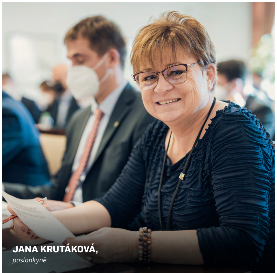
JANA KRUTÁKOVÁ, poslankyně

V současnosti má Česká republika vybudovaný takový systém sběru a třídění nejen PET lahví, že by nám jej mohla závidět většina Evropy – aktuálně jsme v třídění devátí v Evropě. Náš systém je prověřen více než 20lety zkušeností. V momentě, kdy jsme se zavázali k cílům týkajícím se sběru a recyklace obalových materiálů, proběhly velké investice do třídících linek a celé infrastruktury odpadového hospodářství. Severské státy a Německo se vydaly jinou cestou – zavedly povinný systém záloh. Mají tedy úplně jinou startovní čáru a celou koncepci odpadového hospodářství. Již nyní našim fungujícím způsobem dokážeme vytrždit 8 z 10 PET lahví uvedených do oběhu a toto číslo kontinuálně roste. Průměrná vzdálenost nádob na tříděný odpad v loňském roce klesla na 87 metrů. Místo sešlápnuté lahve, kterou odnesete do nádoby kousek od bydliště nyní naložíte auto nesešlápnutými PET láhvemi a povežete je zpět do obchodu. Tyto PET lahve se pak budou opět převážet a následně zpracovávat. Tok obalů od spotřebitele zpět přes výkup ke zpracovateli není dosud znám, a proto nemohu zodpovědně posoudit ekonomiku a ekologii tohoto systému. Pokud by systém svozu byl u nás nastaven podobně jako na Slovensku, pak těžko můžeme hovořit o vstřícném postoji k ekologii či ekonomice. Jednalo by se