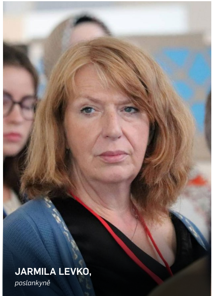
JARMILA LEVKO, poslankyně

O práci v PS NATO příliš nemluvíme, protože opoziční politici i část veřejnosti nám podsouvá, že angažování v zahraniční poli-