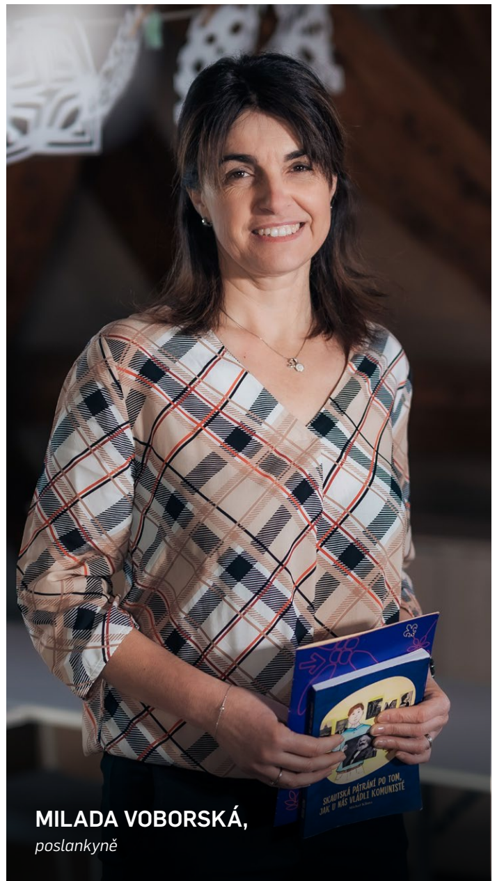
MILADA VOBORSKÁ, poslankyně

Moderovaný seminář proběhne 11. 1. 2024 v sále Státních aktů PSP od 13 hodin.