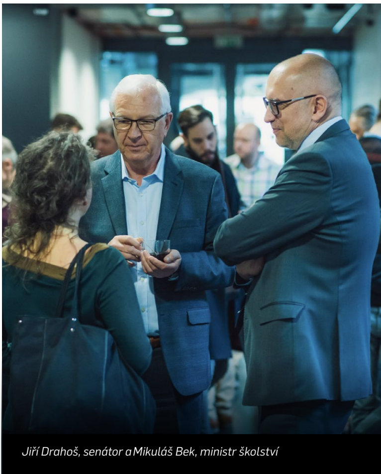
Jiří Drahoš, senátor a Mikuláš Bek, ministr školství

V rámci svého působení v Senátu se snažím, abychom se tomto osudu vyhnuli a aby byly nejen vzdělávání, ale také