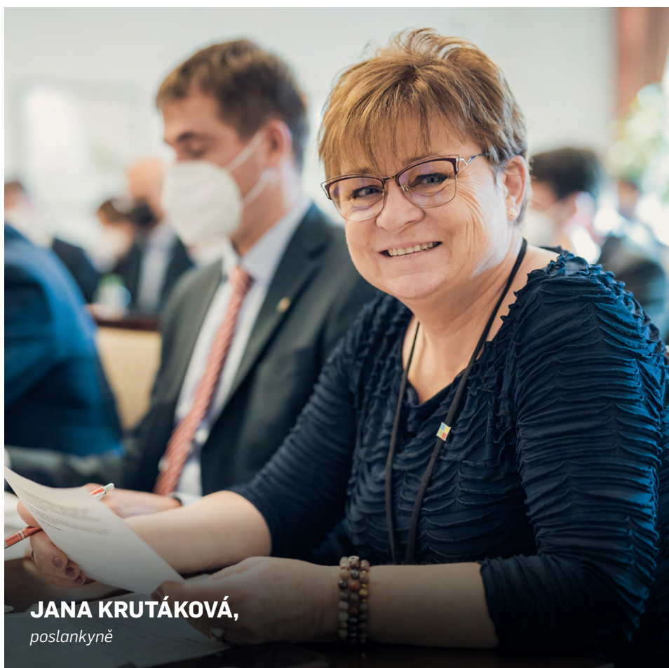
JANA KRUTÁKOVÁ, poslankyně

Již nyní našim fungujícím způsobem dokážeme vytrždit 8 z 10 PET lahví uvedených do oběhu a toto číslo kontinuálně roste. Průměrná vzdálenost nádob na tříděný odpad v loňském roce klesla na 87 metrů. Místo sešlápnuté lahve, kterou odnesete do nádoby kousek od bydliště nyní naložíte auto nesešlápnutými PET láhvemi a povežete je zpět do obchodu. Tyto PET lahve se pak budou opět převážet a následně zpracovávat. Tok obalů od spotřebitele zpět přes výkup ke zpracovateli není dosud znám, a proto nemohu zodpovědně posoudit ekonomiku a ekologii tohoto systému. Pokud by systém svozu byl u nás nastaven podobně jako na Slovensku, pak těžko můžeme hovořit o vstřícném postoji k ekologii či ekonomice. Jednalo by se