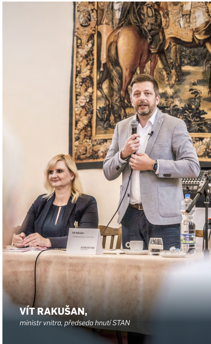
VÍT RAKUŠAN, ministr vnitra, předseda hnutí STAN

Není ovšem možné, aby se některá z členských zemí na řešení migrace nepodílela vůbec. A v tom je jádro kritiky migračního paktu, která zaznívá od ANO, SPD a (chce se mi napsat dalších) extremistů: pod zástěrkou kritiky (neexistujících) povinných kvót, zpochybňování „povinné solidarity“ a výkřiky o „zradě“ se skrývá jediné: Neochota jakkoliv se podílet. Ti, kdo tvrdí, že nechtějí pomáhat „povinně“, ve skutečnosti nechtějí pomáhat vůbec. Jestli je to „jen“ sobectví, nebo kalkul – vždyť Andrej Babiš už strašením