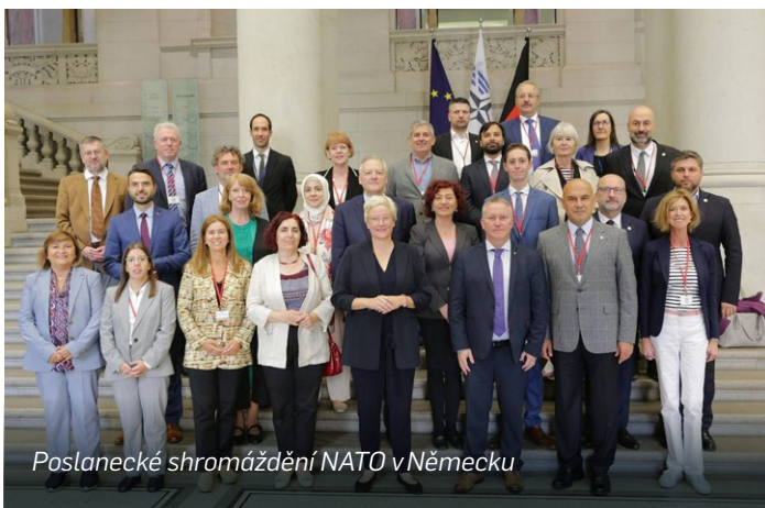
Poslanecké shromáždění NATO v Německu

tice, pomoc válčící Ukrajině nebo zvyšování výdajů na obranu je na úkor našich občanů. Při všem tom řešení domácích horkých problémů si ale musíme být vědomi toho, že dění ve světě a otázky naší bezpečnosti jsou nakonec nad tím vším. Jsou na prvním místě, jenom si to nejsme někdy ochotni uvědomit. Protože když nebudeme v bezpečí, ostatní témata pozbývají smysl. Jsem ráda, že jsme součástí NATO.