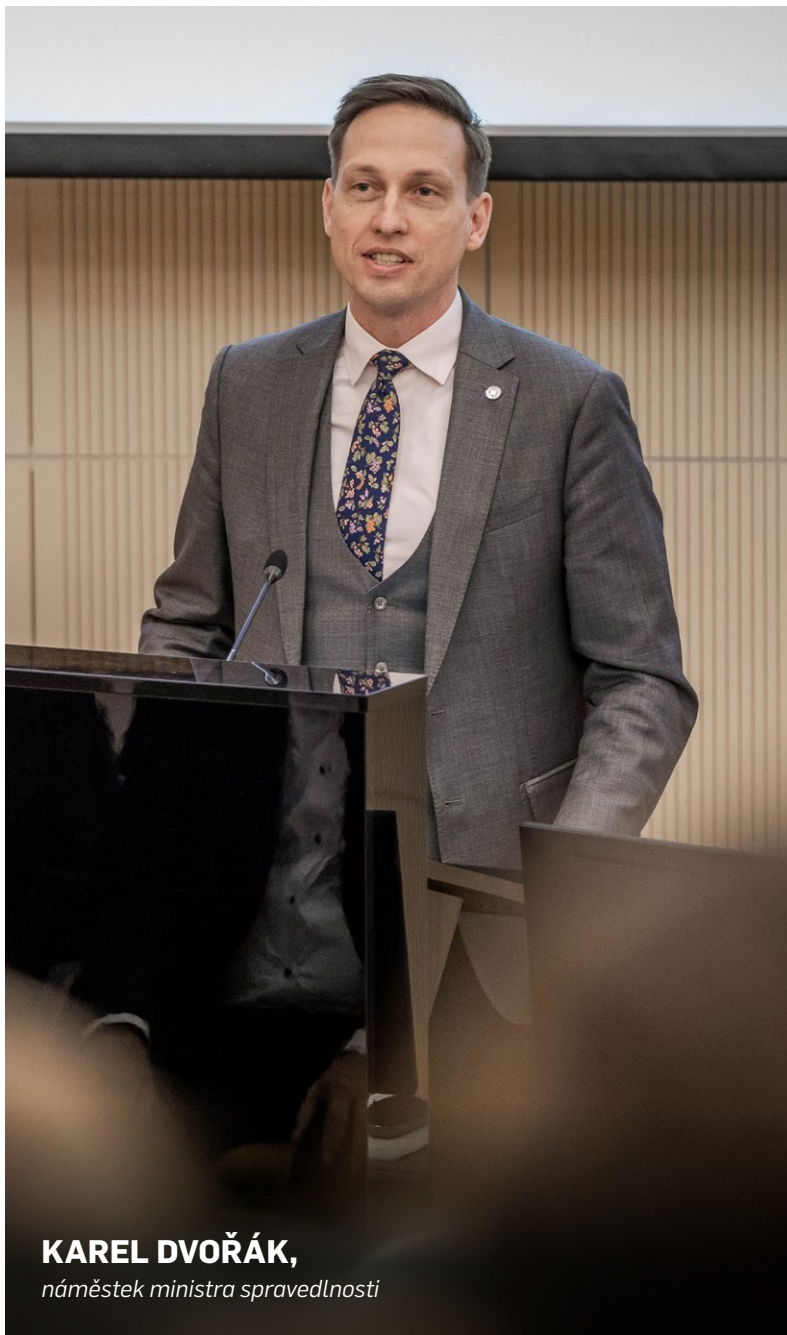
KAREL DVOŘÁK, náměstek ministra spravedlnosti

Zavedeme funkční systém evidence opatrovanců, což pomůže obcím s financováním výkonu veřejného opatrovnictví.