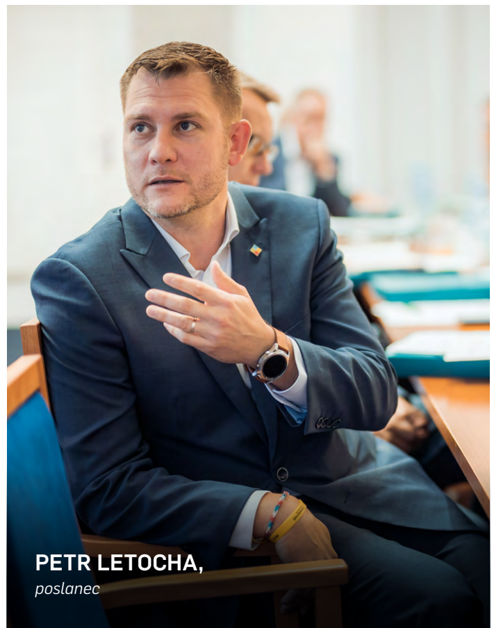
PETR LETOCHA, poslanec

Nejsou to však jen zprávy, jak se podvodníci snaží vylákat ze svých obětí citlivé údaje a později i peníze. Čím dál častěji používají tzv. vishing, což není nic jiného než telefonát, který vede podvodník s často nic netušícími lidmi jednájící v dobré víře, že chce podvodník pomoci jim samotným či jejich blízkým. Útočník se často představuje jako zaměstnanec banky či investiční poradce. Snaží se vytvořit iluzi naléhavé situace, ve které po své oběti buď vyžaduje, aby mu sdělila přístupové údaje ke svému internetovému bankovníctví, případně aby mu neprodleně pod rouškou investic nebo ochrany jejich blízkého zaslala pe-