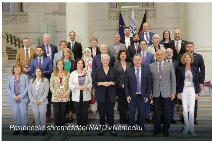
Poslanecké shromáždění NATO v Německu

tice, pomoc válčící Ukrajině nebo zvyšování výdajů na obranu je na úkor našich občanů. Při všem tom řešení domácích horkých problémů si ale musíme být vědomi toho, že dění ve světě a otázky naší bezpečnosti jsou nakonec nad tím vším. Jsou na prvním místě, jenom si to nejsme někdy ochotni uvědomit. Protože když nebudeme v bezpečí, ostatní témata pozbývají smysl. Jsem ráda, že jsme součástí NATO.