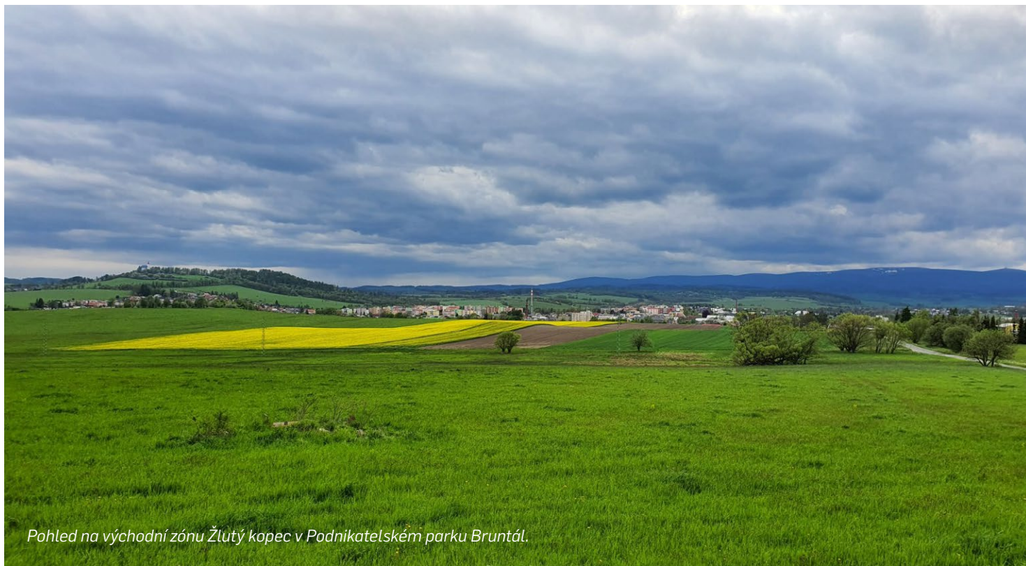
Pohled na východní zónu Žlutý kopec v Podnikatelském parku Bruntál.

– Turnov – Liberec – Frýdlant – hranice PL. Doplněním výše uvedených staveb do Přílohy č. 1 dojde k možnosti uplatnění institutu mezitímního rozhodnutí pro konkrétní stavby, které se nacházejí v pokročilém stupni přípravy, jejich dopravní a stavebně-technické řešení bylo odborně ověřeno a akceptováno, zaneseno do územně-plánovací dokumentace a v průběhu příštích let tak lze reálně očekávat zahájení povolovacího procesu a také vlastní realizaci. K pozměňovacímu návrhu poslance Rataje se připodepsali i další poslanci z Moravskoslezského kraje napříč politickým spektrem.