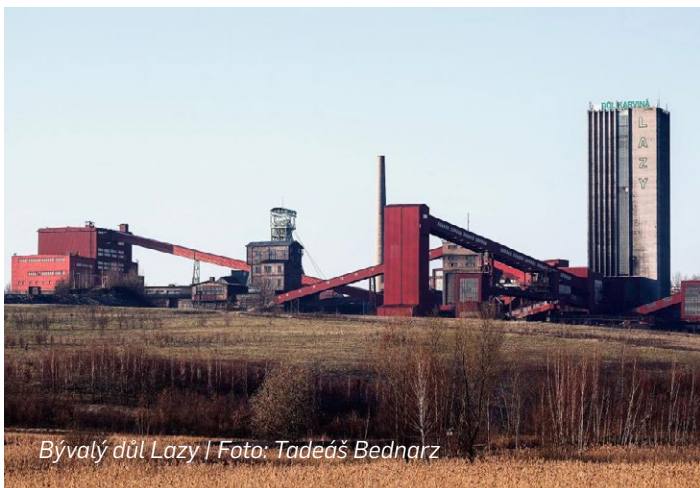
Bývalý důl Lazy

První varianta návrhu vyjmenovává osm konkrétních lokalit. Kromě lokality Líně v Plzeňském kraji, obsažené v původním schváleném pozměňovacím návrhu, obsahuje pozměňovací návrh poslance Rataje sedm lokalit ze tří strukturálně postižených krajů, mimo jiné i Podnikatelský park Bruntál, Lazy a svatou Barboru u Karviné v kraji Moravskoslezském. Druhá varianta pak dává ještě větší možnosti, jelikož za tyto strategické lokality označuje celé tři kraje: Moravskoslezský, Ústecký a Karlovarský kraj. Hospodářský výbor ve čtvrtek 19. října vyjádřil souhlasné stanovisko k variantě konkrétních lokalit (verze D1).