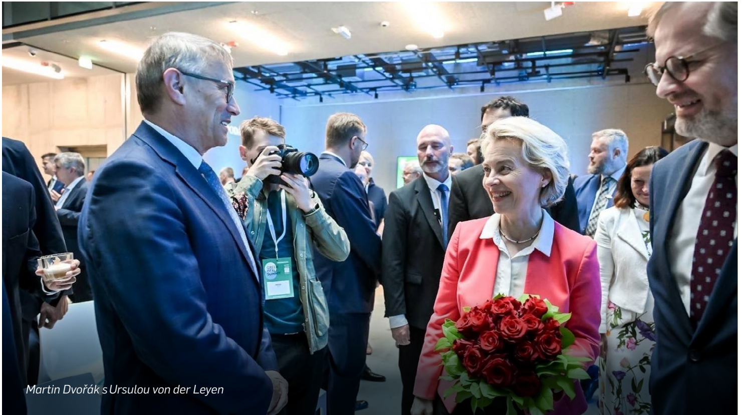
Martin Dvořák s Ursulou von der Leyen