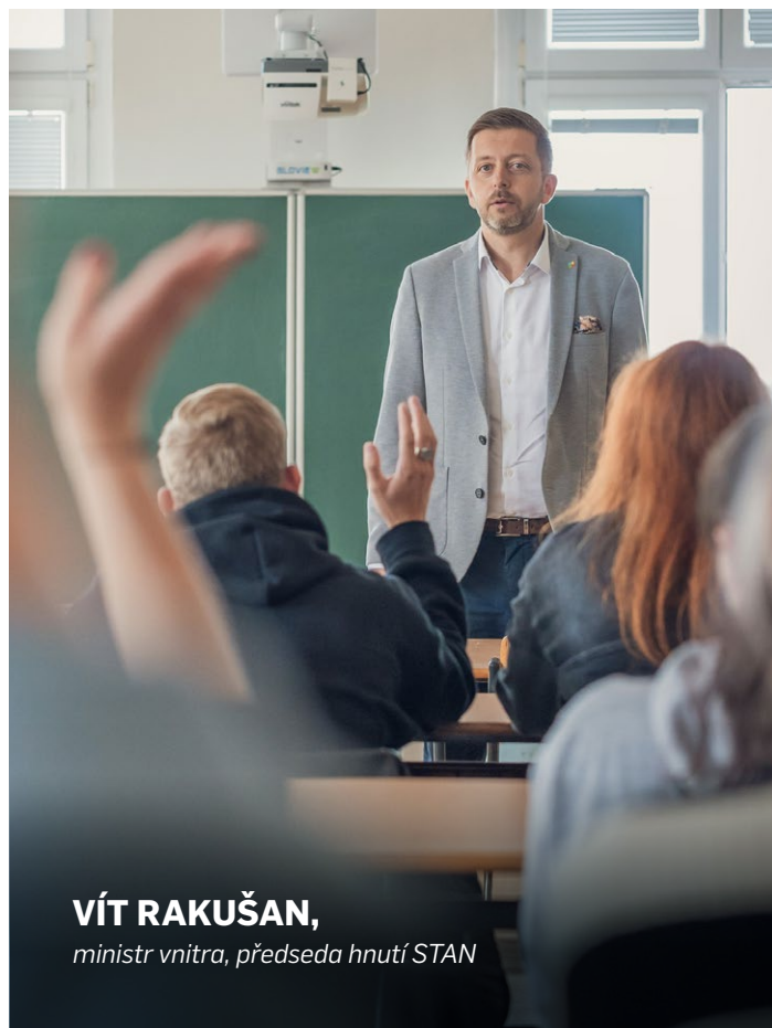
VÍT RAKUŠAN, ministr vnitra, předseda hnutí STAN