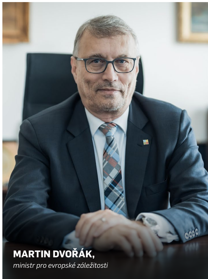
MARTIN DVOŘÁK, ministr pro evropské záležitosti

Nejspíš nebude velkým problémem debata o počtu členů Evropské komise a nastavení mechanismu, jak dát všem členům stejnou šanci se podílet na rozhodování v tomto vrcholném orgánu. Relativně snadno by se snad hledal kompromis při stanovování počtu členů Evropského parlamentu. Těžší už asi bude debata o rozdělování finančních zdrojů. Nemůžeme si zastírat, že Česko a další země se po přijetí nových členů velmi pravděpodobně stanou z „čistých příjemců“ „čistými plátcí“ a inkaso z evropských fondů bude nižší než výše příspěvků. To bude jistě jedním z cílů útoků opozice, národovců a všech, kteří stále berou EU jen jako kasičku. Pokud ale bereme EU jako společenství národů a zemí, které pojí společné hodnoty a navzájem si pomáhají, musíme si uvědomit, že za 20 let našeho členství jsme v čistém saldu přijali o jeden bilion korun víc, než kolik jsme dosud odvedli. Není na čase, abychom začali nějaké peníze zase pomalu vracet? Nejsme přece takoví chudáci, abychom za sebe nechali platit jiné! Vyrovňávání životního standardu v různých částech unie vždy bylo jedním z principů, na kterém EU od samého zrodu funguje a Česko z toho celá léta profitovalo. Ponechat bez korekce zaostávání některých regionů v konečném důsledku přináší nebezpečí narůstající frustrace a sociálních tenzí. Varováním by měla být situace v zaostávajících regionech u nás. Vidíme, jak se některé oblasti vzdalují nejen ekonomicky a sociálně, ale také