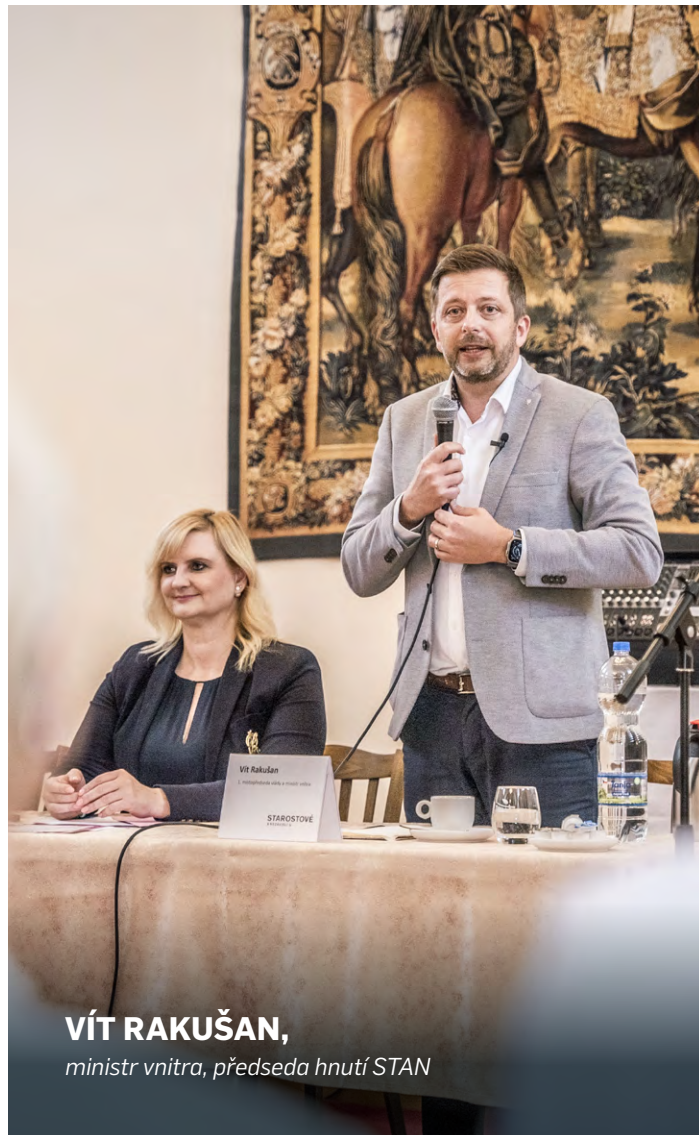
VÍT RAKUŠAN, ministr vnitra, předseda hnutí STAN

Není ovšem možné, aby se některá z členských zemí na řešení migrace nepodílela vůbec. A v tom je jádro kritiky migračního paktu, která zaznívá od ANO, SPD a (chce se mi napsat dalších) extremistů: pod zástěrkou kritiky (neexistujících) povinných kvót, zpochybňování „povinné solidarity“ a výkřiky o „zradě“ se skrývá jediné: Neochota jakkoliv se podílet. Ti, kdo tvrdí, že nechtějí pomáhat „povinně“, ve skutečnosti nechtějí pomáhat vůbec. Jestli je to „jen“ sobectví, nebo kalkul – vždyť Andrej Babiš už strašením